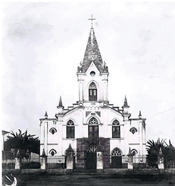
FIGURA 11 – Nova Igreja da Matriz de Carmo da Mata (c. 1920).