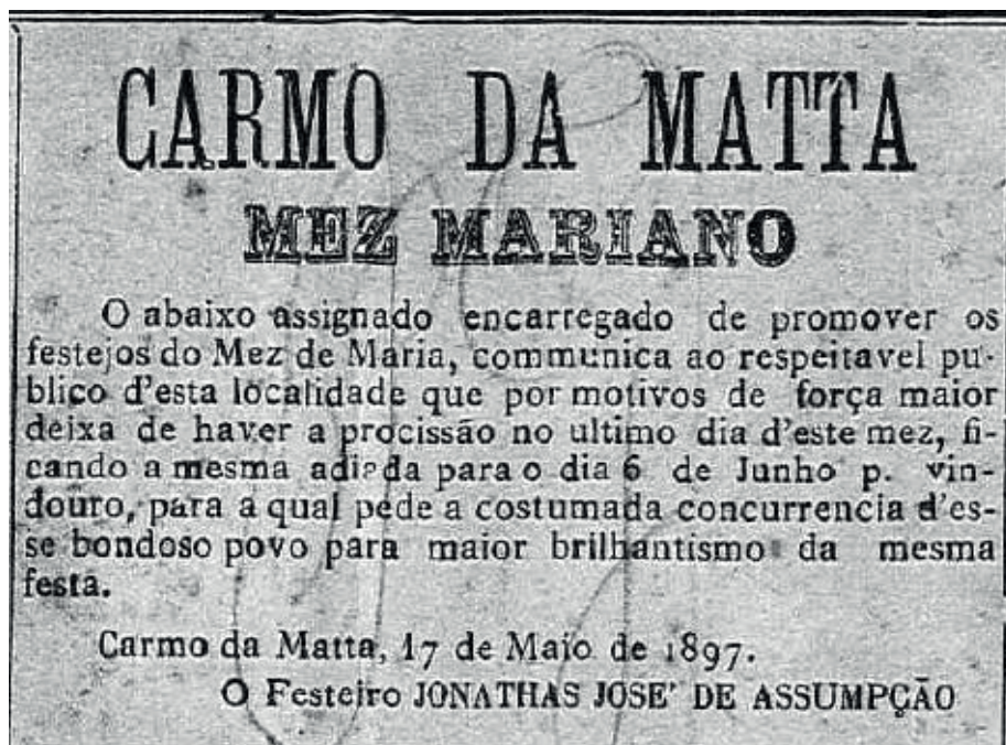
FIGURA 3 – Anúncio jornalístico do Mês Mariano em Carmo da Mata.