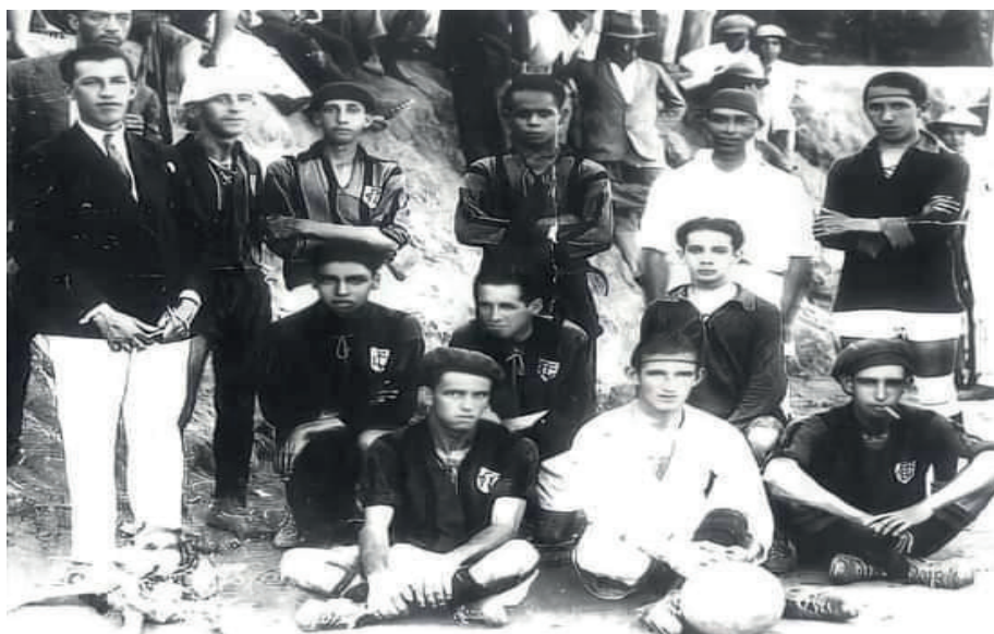
Figura 15 – Estrela do Oeste Foot-Ball Club (anos mais tarde chamado de Associação Carmense de Esportes ), c. 1920.