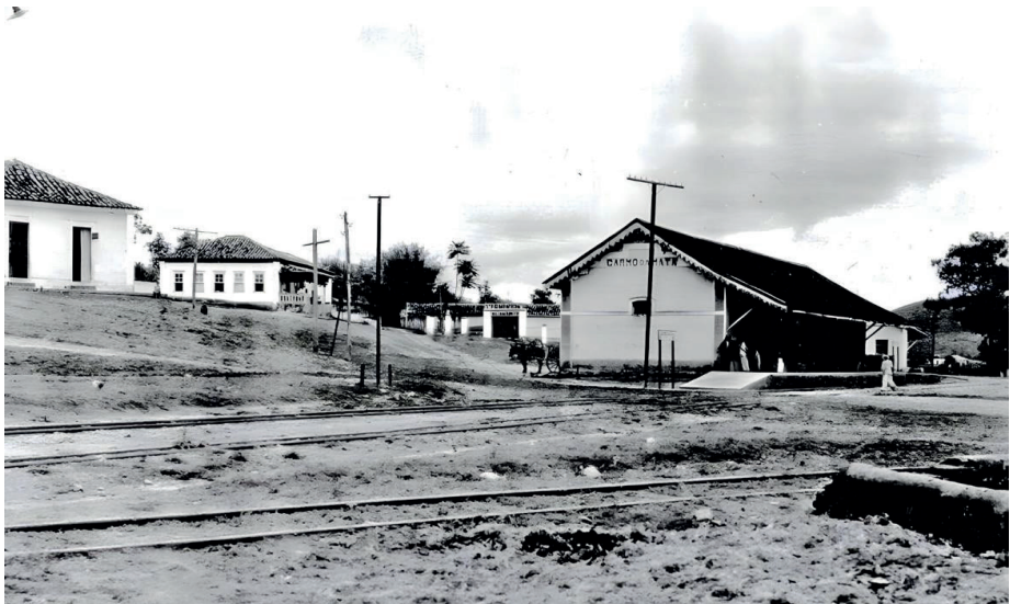
FIGURA 12 – Novo prédio da Estação Ferroviária de Carmo da Mata construído em 1918 (c.1920).

Foto dos anos 1920.