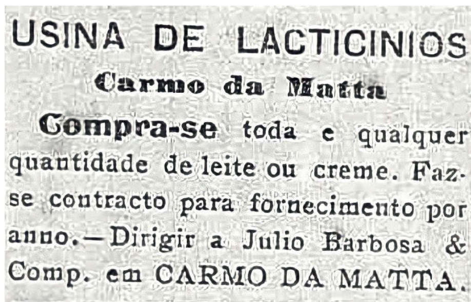
FIGURA 10 – Anúncio do interesse da compra de leite da fábrica Júlio Barbosa & Cia.

Fonte: GAZETA DE MINAS, 31 dez. 1916, p. 3.