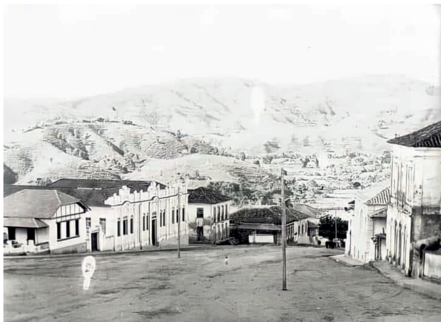
FIGURA 1 – Vista panorâmica da parte citadina de Carmo da Mata (c. 1920).