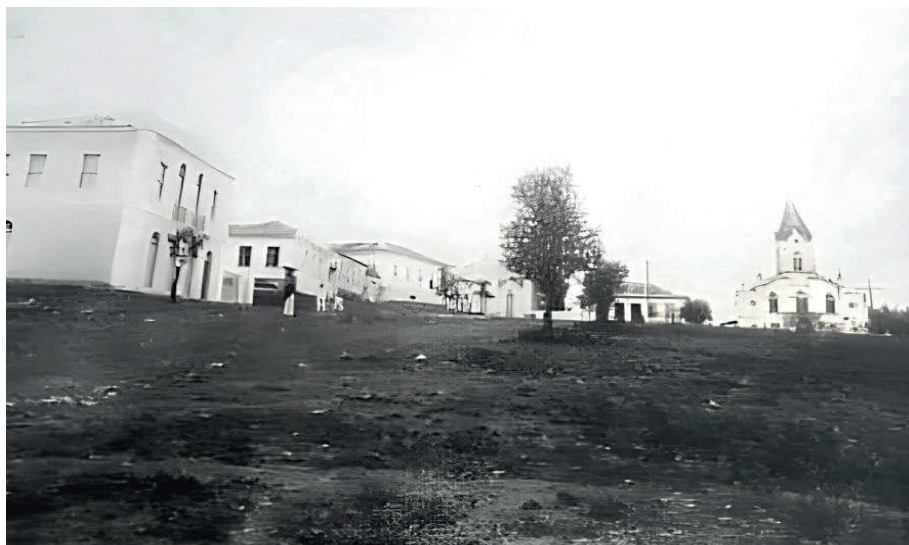
Figura 13 – Largo da Matriz de Carmo da Mata, c. 1910-1920. O primeiro sobrado, na parte esquerda da imagem, serviu como sede do Club Carmense .