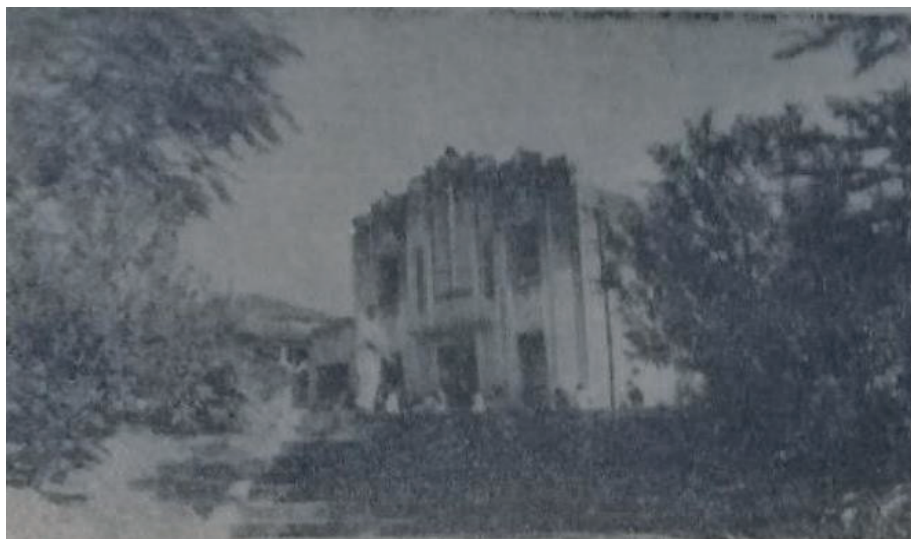
Figura 14 – Prédio do Cinema Progresso inaugurado, na sede carmense, em maio de 1911 (c. 1920).