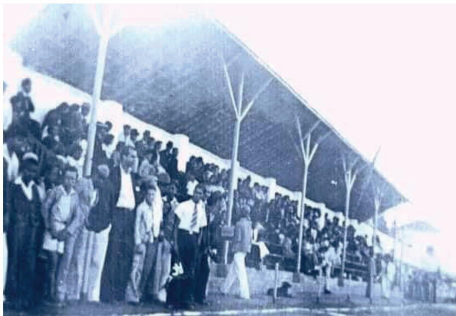
FIGURA 16 – Estádio do Estrela do Oeste Foot-Ball Club, c. 1920.