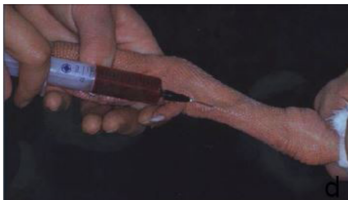
Figura 3. Veia matatarsiana medial - Fonte: adaptado de Konig eLiebich (2012)

Outra opção importante para a coleta de sangue é a veia metatarsiana medial, que pode ser acessada em aves que tenham problemas para possibilitar o acesso à veia jugular, como é o caso de pombos e, em geral, as aves que tenham comida no papo, pois não afetará a ingestão do alimento (Figura 3) (BOETTCHER, 2004).