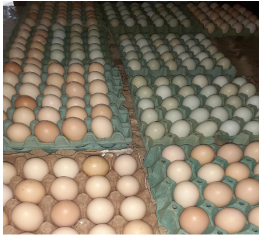
Figura 03. Diversidade de Cores das cascas dos ovos.