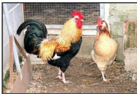
Figura 13. Raça galinha Mallorquina