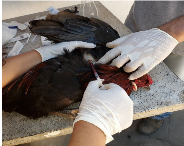
Figura 2. Coleta sangue pela Veia ulnar (ou da asa)

Outra opção importante para a coleta de sangue é a veia metatarsiana medial, que pode ser acessada em aves que tenham problemas para possibilitar o acesso à veia jugular, como é o caso de pombos e, em geral, as aves que tenham comida no papo, pois não afetará a ingestão do alimento (Figura 3) (BOETTCHER, 2004).