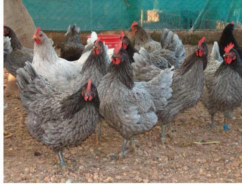
Figura 11. Raça de galinhas Extremena Azul