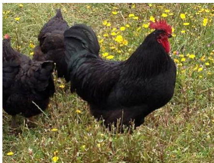
Figura 6. Galinhas Raça Preta Lusitânica

De plumagem completamente preta, havendo a possibilidade de apresentar reflexos azul-esverdeados, as galinhas da raça Preta Lusitânica estão ligadas a tradições populares, desde práticas de bruxaria a práticas pagãs. O peso do macho é compreendido entre 2,5-2,9 kg e da fêmea 1,7-2,3 kg. Essa raça apresenta dimorfismo sexual (DGAV, 2013; CID, 2017).