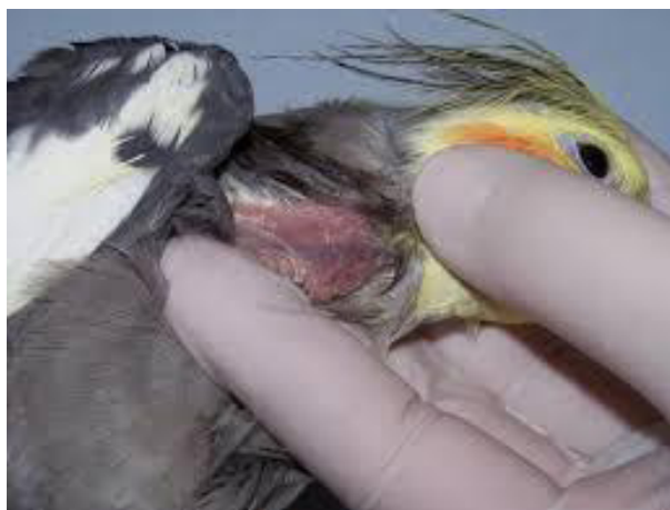
Figura 1. Veia jugular direita

Um dos principais locais de colheita sanguínea em aves é a veia jugular direita, que – é utilizada com frequência porque apresenta baixa predisposição a formar hematomas e tem calibre aumentado, o que também dificulta a coagulação no momento da coleta (Figura 1). Embora a veia jugular seja móvel e possa dificultar a punção, basta estabilizá-la com auxílio de uma das mãos (CAPITELLI; CROSTA, 2013).