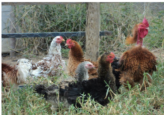
Figura 2. Galinhas da raça Peloco