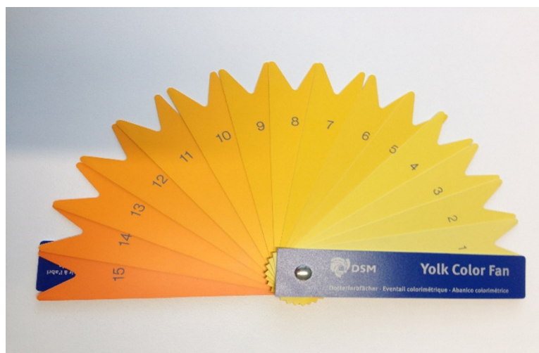
Figura 02. Leque de cores

A coloração da gema depende de dois fatores, a saber: o fator genético e a alimentação da ave. O fator genético seria o responsável por fazer a capacidade genética se tornar individual. Já o fator alimentação se dá devido a pigmentos nas rações e carotenoides do milho (GRANER, 1950).