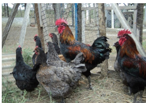
Figura 3. Raça Caneluda do Catolé

As galinhas Caneludas são aves que ainda estão em processo inicial de caracterização fenotípica. Portanto, possuem pequeno número de matrizes e reprodutores e estão em um núcleo do setor de avicultura da Universidade Estadual do Sudoeste da Bahia. Esse grupo genético foi identificado, inicialmente, por um produtor local que atentou para a presença de aves robustas, pernaltas e de plumagem característica (penas negras e em tons cinza-azulado) (ALMEIDA, 2016).