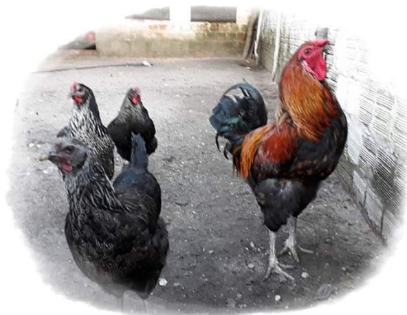
Figura 1. Galinhas caipiras da raça Canela-Preta

Encontradas no estado do Piauí e possivelmente em outros estados da região Nordeste do Brasil, esta raça é criada principalmente por pequenos agricultores familiares e comunidades tradicionais (indígenas e quilombolas). As galinhas da raça Canela-Preta são conhecidas por possuir carne de coloração diferenciada quando comparadas às demais galinhas caipiras. As aves têm duplo propósito: produção de carne e ovos. São animais dóceis, de fácil manejo, com plumagem de coloração predominantemente preta, podendo haver chivilhamento na região do pescoço nas cores branca e dourado (no caso das fêmeas) e branco, prata e vermelho (no caso dos machos). Esse chivilhamento pode se estender em toda plumagem das aves. Possui coloração da canela predominantemente preta (CARVALHO et al., 2017).