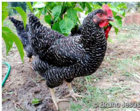
Figura 7. Galinhas raça Pedrês Portuguesa

A plumagem desta raça tem um aspecto mosqueado, matizado de cinzento-escuro em fundo branco, formando barras brancas e cinzentas, descontínuas. O peso do macho é compreendido entre 2,6-3,0 kg e da fêmea 2,2-2,7 kg. A fêmea apresenta as mesmas características que o macho, ressalta-se o dimorfismo sexual visível pelo tamanho e peso menores para a fêmea. São galinhas muito apreciadas em seu país, considerada uma raça tradicional, existindo provérbios populares a comprová-lo: “Galinha Pedrês vale por três” e “Galinha Pedrês, não a mates nem a dê” (DGAV, 2013; CID, 2017).