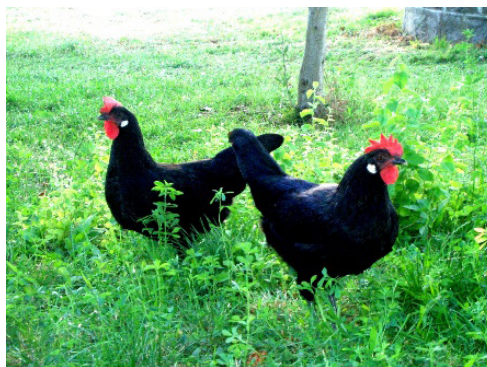
Figura 9. Raça Catellana Negra