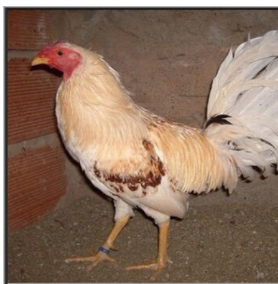
Figura 10. Raça de galinhas Combatiente Español

Ave que muito se assemelha fenotipicamente a Gallus Bankiva (galinhas selvagens, às quais se atribui maior contribuição nas aves domésticas da atualidade). O Combatiente Español é difundida em várias regiões da Espanha e muito utilizada para exportação. A plumagem é muito variada, com reflexos metálicos, cor predominantemente vermelha ou laranja forte, brilhante, que varia do preto ao branco, contendo todos os tons. Os machos têm o peito de cor preto brilhante e cauda larga de cor preta. Nas fêmeas predomina a cor marrom. Raça de pequeno porte, os machos pesam entre 1,5 a 2kg e as fêmeas 1 a 1,5kg (MAPA, 2019).