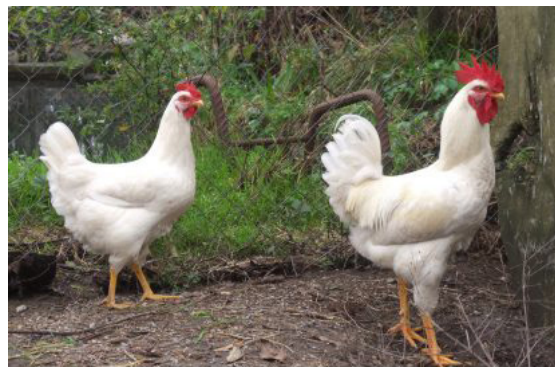
Figura 5. Galinhas Raça Branca

A plumagem dessas aves é completamente branca. A cabeça é moderadamente grande, forte e robusta. O bico tem um tamanho médio a grande, ligeiramente encurvado. O peso do macho é compreendido entre 2,3-3,2 kg e da fêmea 1,5-2,3 kg. A fêmea apresenta as mesmas características que o macho, destacando dimorfismo sexual visível pelo tamanho e peso menores para a fêmea (DGAV, 2013).