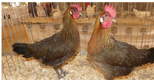
Figura 16. Ra a galinha Variedade Utrerana Perdiz

Encontradas na região de Andaluc a, principalmente nas cidades de Sevilla, C rdoba e, em menor quantidade, em C diz e Huelva. Ra a em risco de extin o. Com plumagem de cores distintas, possuem quatro variedades dentro da ra a: Utrerana Perdiz, Utrerana Preta, Utrerana Branca e Utrerana Franciscana. Produz ovos com peso m dio de 63 gramas (MAPA, 2019).