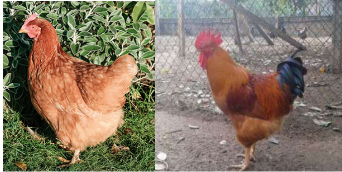
Figura 4. Fêmea e Macho das Galinhas da raça Amarela

Galinhas de porte médio, com a plumagem de cor castanha alaranjada escura, em fundo amarelo palha; na cauda e na extremidade das asas apresentam uma cor negra, com reflexos azul-esverdeados. As fêmeas apresentam as mesmas características que os machos, ressaltando o dimorfismo sexual visível pelo tamanho e peso menores para a fêmea (DGAV, 2013).