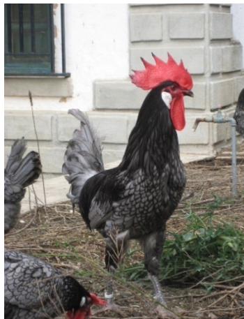
Figura 8. Galinhas raça Andaluza Azul

Encontradas na região de Andalucía, principalmente nas cidades de Sevilla, Córdoba e núcleos importantes em Cádiz e Huelva. De crista simples e orelhas branca, Andaluza Azul é uma raça de cor da plumagem cinza azulado, com bordas pretas em cada uma de suas penas. Raça em risco de extinção, os machos possuem camadas de plumagem mais escura que as fêmeas. De porte médio, os machos pesam 2,9 a 3,5 kg e as fêmeas 2,2 a 2,8 kg (MAPA, 2019).