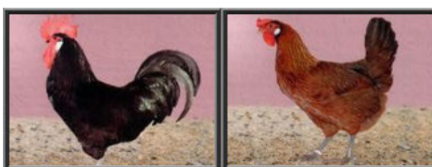
Figura 15. Raça galinha Sureña (JIMBO, 2019)

Raça originária da região de Andalúcia. Também é conhecida como Andaluza Sureña. Com coloração de plumagens distintas, possuem variedades: Franciscana, Cinza, Preta, Branca Pura e Branca cinzenta. Essa raça possui peso médio para machos de 3,5 a 3,8 kg e para fêmeas 2,5 a 2,7 kg. Ovos de cor branca, com peso médio de 65 gramas. As fêmeas possuem cristas caídas para o lado, cobrindo o olho (JIMDO, 2019).