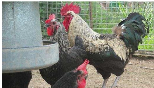
Figura 12. Raça galinhas Ibicenca

A área geográfica onde se encontra essa raça de galinhas é a Ilha de Ibiza e, possivelmente, a Ilha de Formentera, território próximo que durante alguns anos foi dependente de Ibiza. Sua cor possui plumagem variada: preta prateada, preta marrom e preto barrado. As galinhas da raça Ibicenca possuem peso médio para machos 3,5 kg e para fêmeas 2,5 kg. Aves de duplo propósito (carne e ovos) (GOIB, 2019).