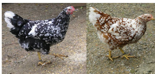
Figura 14. Raça galinha Pita Pinta

Originária da região de Astúrias, essa raça está em risco de extinção. Possui variedades distintas de coloração de plumagem: preta com pontos brancos, laranja com pontos brancos, toda branca, toda preta ou preta com capa prateado ou dourado. O peso dos machos é, em média, 3,75 kg e das fêmeas 2,25 kg. Os ovos são de cor marrom claro (MAPA, 2019).