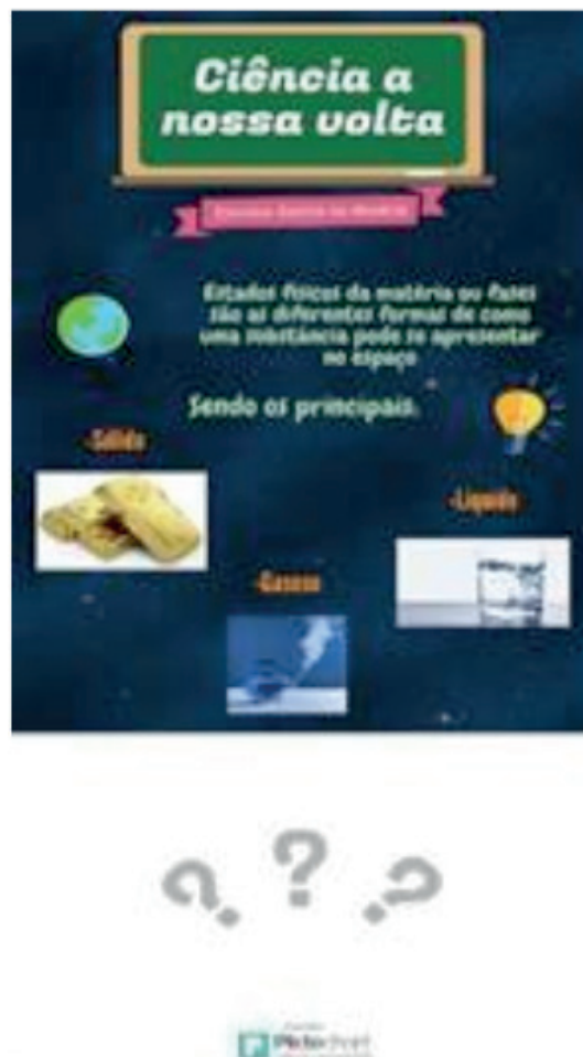
Figura 3- Os estados da matéria