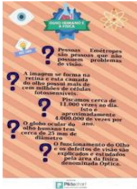
Figura 3- Infográfico sobre o olho humano