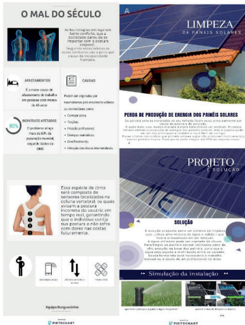
Figura 6- Infográficos sobre as temáticas Corpo Humano x Tecnologia e Energia x Tecnologia