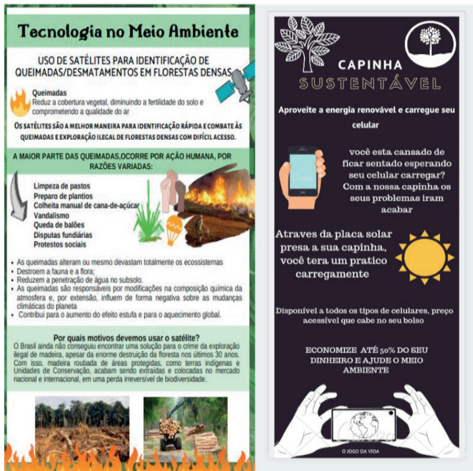
Figura 5- Infográficos sobre as temáticas Meio ambiente x Tecnologia e Energia x Tecnologia