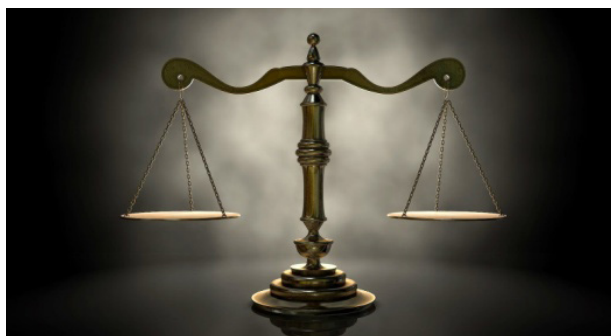
Figura - 1 Justiça

Crítica deriva de crisis, crise. Julgar, ponderação, peso