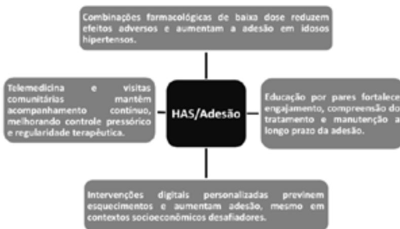
FIGURA 2: Síntese dos resultados mais encontrados de acordo com os artigos analisados.