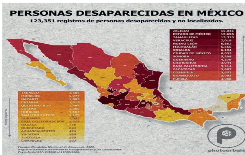
Gráfico obtenido de la Comisión Nacional de Búsqueda: Consultado agosto 11 2025

https://www.google.com/search?sca_esv=dc503ec08667be7&sxsrf=AE3TifOAeT-t2vywLECEh0GBUza6ek7E6dg:1754969916616&q=mapa+de+mexico+de+personas+desaparecidas+actual&udm=2&source=univ&fir=eNLPASAgIKu2WM%252C949k8b20XBNz-2M%252C_%253BJF6P8JvnnUCsCM%252CKij_UEnLxeHYWM%252C_%253BLZrOkUSoaB-TotM%252C949k8b20XBNz2M%252C_%253BpL6InEMaSMwm9M%252Chu8hfqDNEY-WP2M%252C_%253BGdnJY41h2byFZM%252C52qtz73vEcTnjM%252C_%253BKBZ2-uWy-zD52YM%252CsrdsKI-pfqQqkM%252C_%253Bg3DmqBK3CJB-_M%252C9XtSIgxo8Ys7D-M%252C_%253B9hqu6TjYJx_M%252CKij_UEnLxeHYWM%252C_%253BcAQRXXfe-w8GkM%252Coc4_63PMqr5GVM%252C_%253BJv6va7w_-wfPrM%252CWVbEgArP93ti-wM%252C_%253B-ntUX4o_Ri1jNM%252COWafiDzfesCgM%252C_%253BuovOTCI9Fa5z-FM%252CKij_UEnLxeHYWM%252C_&usg=AI4_-k3Q-Q-b7cf0rjpmVHQXhg-m3ImCw&sa-X&ved=2ahUKEwj8xOKzrISpAXWoD0QIHacgMVoQ7Al6BAgdEAU&biw=927&bih=967&dpr=1