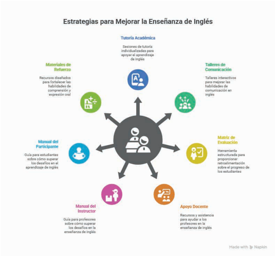
Tabla 2. Problemáticas y propuestas de atención.