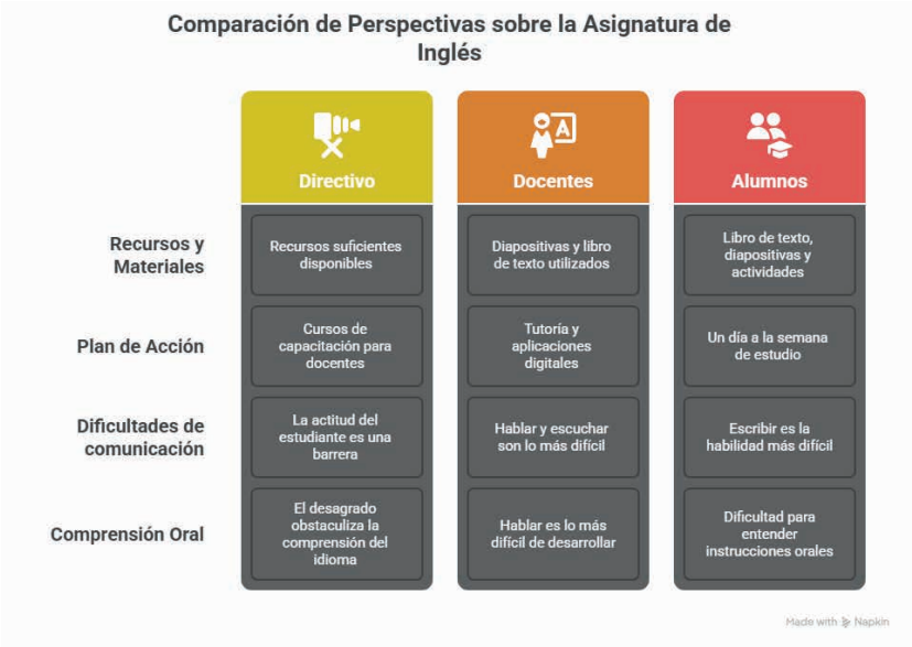
Tabla 1. Análisis de resultados recabados por medio de instrumentos de diagnóstico.

Al finalizar con el proceso de intervención, se llevará a cabo una evaluación que recopile los resultados alcanzados a lo largo de las sesiones de trabajo.