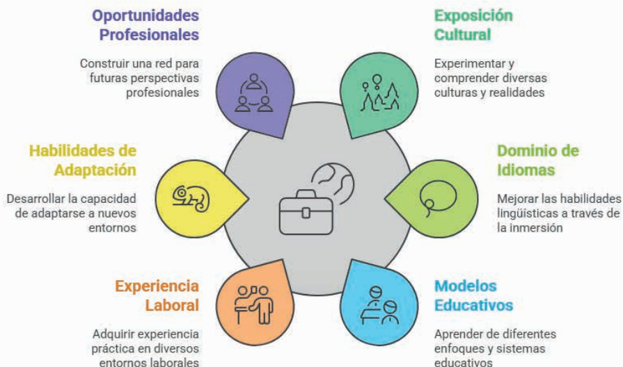
Imagen 1: Beneficios

La movilidad estudiantil puede ser nacional o internacional. En el caso de la movilidad internacional, los estudiantes pueden cursar un ciclo académico en una universidad extranjera, también es necesario considerar que puede ser virtual, lo que permite a los estudiantes seguir aprendiendo desde su lugar de residencia.