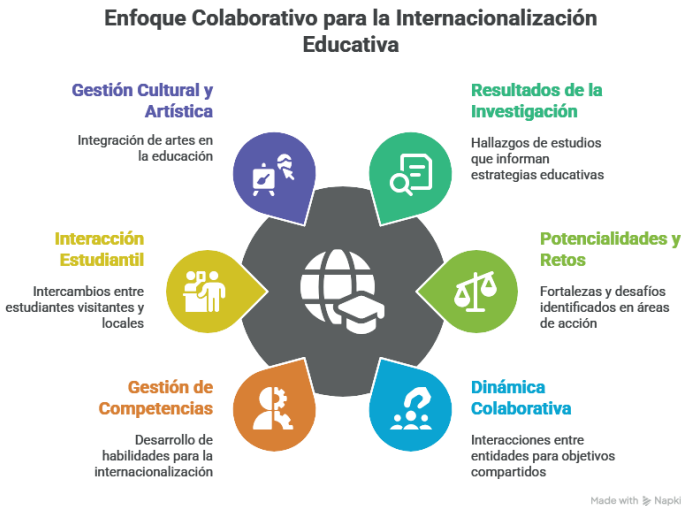
Imagen 2, metodología

Con base en los resultados obtenidos y considerando las potencialidades y retos identificados en las áreas de acción de cada entidad involucrada, se estableció una dinámica de trabajo colaborativo orientada a diseñar y proyectar experiencias educativas que fortalezcan la internacionalización desde una perspectiva cultural y artística. Este enfoque promueve la gestión conjunta de competencias y capacidades para la internacionalización, generando espacios de interacción enriquecedores entre estudiantes visitantes y alumnos de la Universidad Veracruzana. Así, la gestión cultural y artística no solo amplía el horizonte formativo de los estudiantes, sino que también fomenta el intercambio intercultural, la valoración del patrimonio y la responsabilidad social en un mundo globalizado.