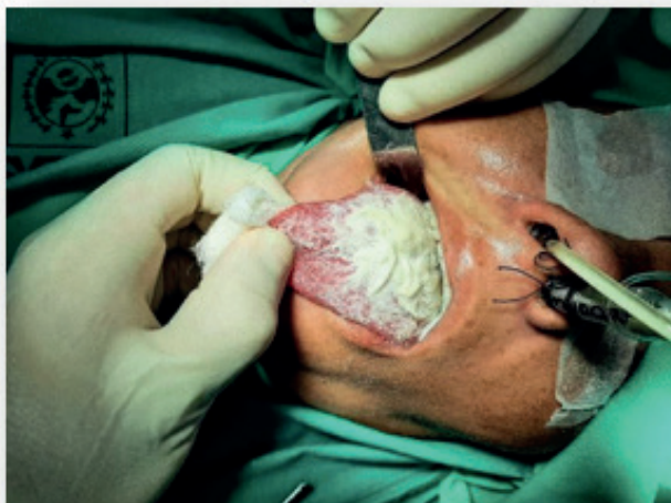
Imagem 1- Placa branca cobrindo todo o dorso lingual observada à inspeção intraoral

Nos preparativos cirúrgicos, à inspeção intraoral para intubação nasotraqueal para a anestesia geral, constatou-se uma extensa placa branca que cobria toda a região do dorso lingual. Essa lesão possuía característica espessa, gelatinosa e amolecida que, quando submetida à raspagem com compressa de gaze, revelava uma superfície eritematosa, ulcerada, levando a um diagnóstico clínico de candidíase pseudomembranosa.