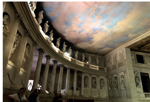
Imágenes 25 y 26. El Teatro Olímpico

El Teatro Olímpico fue la última obra de Palladio, la cual no pudo terminar. Además de toda la escenografía que rodea al teatro, son particularmente interesantes las vistas en fuga que se consiguieron en el escenario (Cedeño, 2023).