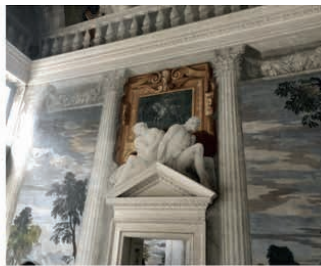
Imágenes 12 y 13. Villa Barbaro

La imagen 12 nos muestra la fachada y, el ala derecha, con la que cuenta a pesar de no tratarse de una villa con un fin productivo. La imagen 13 nos muestra un detalle pictórico del interior (Cedeño, 2023).