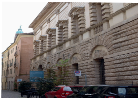
Imagen 20. Palacio Thiene

proyectadas, siendo la parte no construida la parte más interesante del proyecto, con una fachada que daría a la avenida principal de la ciudad de Vicenza (Rigon, 1980).