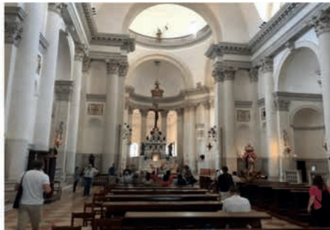
Imágenes 22 y 23. San Giorgio Maggiore

La imagen 22 nos permite apreciar la fachada de San Giorgio de inspiración romana. La imagen 23 nos muestra el purismo arquitectónico de Palladio al interior de la iglesia (Cedeño, 2023).