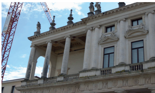
Imagen 21. Palacio Chiericati

El palacio Chiericati (1550), armoniosamente proporcionado, de espíritu clásico, aunque con la suficiente originalidad de tratamiento de fachada, con un contraste entre claro y macizo, que se considera un magnífico edificio. “Es el único palacio de Andrea Palladio que se ajusta prácticamente en su totalidad a los planos de su autor” (Wundram y Pape, 2004, pp. 78). Girolamo Chiericati era uno de los que apoyaban a Palladio para que se hiciera cargo de la Basílica, en el mismo momento que Palladio construía este palacio. “Para brindarle una mayor magnificencia, pero también para protegerlo de las frecuentes inundaciones (pero también de los bovinos que eran vendidos delante del palacio los días de mercado), Palladio lo eleva sobre un podio con una escalinata central claramente prestada de un templo antiguo. La extraordinaria novedad de este palacio en el panorama de las residencias urbanas renacentistas se debe a la extraordinaria capacidad palladiana de interpretar el lugar en el cual surge”. Un contexto que lo hace un edificio ambiguo, palacio y villa suburbana juntos (Beltramini, 2014, pp. 20).