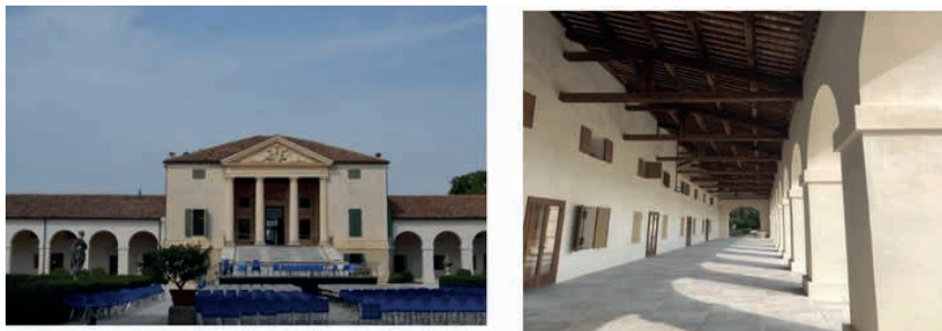
Imágenes 16 y 17. Villa Emo

La Villa Emo se puede considerar como el éxito de una nueva tipología, donde las necesidades prácticas de la vida agrícola se traducen en una forma inédita y en un lenguaje inspirado en la arquitectura antigua. Fue construida por Palladio entre 1558 y 1565, en medio de vastos terrenos que Leonardo Emo poseía en el campo, cuya trama y orientación remite a los antiguos diseños de los centuriones romanos, ya que por la zona era atravesada por la antigua vía Postumia (Beltramini, 2014). Una equilibrada coexistencia compositiva entre la tradición constructiva véneta de los siglos XV y XVI y la recuperación de la cultura romana antigua encuentra la confirmación, en la fusión entre edificio y paisaje. El interior cuenta con frescos de Giambattista Zelotti (Rigon, 1980). Palladio menciona en sus Cuatro libros a los graneros y pabellones a ambos lados del edificio principal a los cuales se accedía sin necesidad de salir al aire libre, y cuyas alas laterales son de una longitud poco usual, reflejo de la gran productividad de los campos pertenecientes a la villa. “La villa encarna la forma pura de una instalación productiva que, bajo la idea de la “santa agricultura”, renuncia a toda ostentación, teniendo sin embargo el carácter de núcleo de orden práctico y espiritual de toda la finca” (Wundram y Pape, 2004, pp. 169).