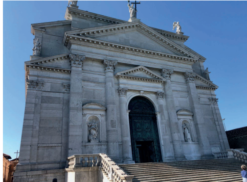
Imagen 24. El Redentor

ventanales semicirculares hechos con un vidrio sumamente transparente, una especialidad de los talleres de la ciudad de Murano conocido con el nombre de cristallo . (Cartwright, 2020).