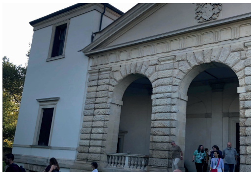
Figura 3. Villa Pisani de Bagnolo

Imagen de la fachada de la Villa Pisani, en la cual se puede apreciar una de las torres laterales, el acabado rústico y parte del frontón. (Cedeño, 2023).