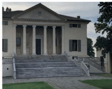
Imágenes 10 y 11. Villa Badoer

La imagen 10 muestra la fachada y parte de las famosas “barchesse” o alas que la circundan, mientras la imagen 11 nos permite admirar la logia jónica de la fachada principal (Cedeño, 2023).