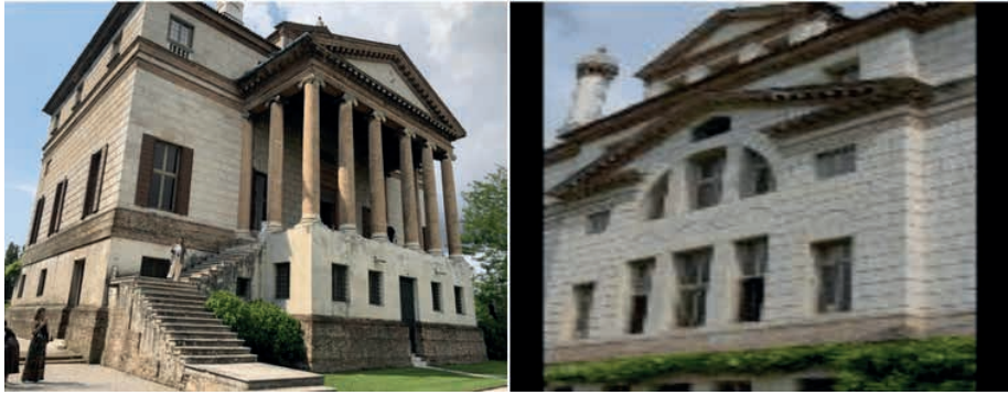
Imágenes 14 y 15. Villa Foscari

La imagen 14 nos muestra la imponente fachada principal que da hacia el río Brenta, mientras que la imagen 15 nos presenta la fachada posterior con su característica ventana termal (Cedeño, 2023).