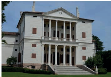
Imágenes 6 y 7. Villa Cornaro

En las imágenes 6 y 7 se pueden ver las fachadas de la Villa Cornaro. La imagen 6 presenta la fachada principal vista desde la calle y la Imagen 7 la fachada posterior que da hacia un amplio jardín (Cedeño, 2023).