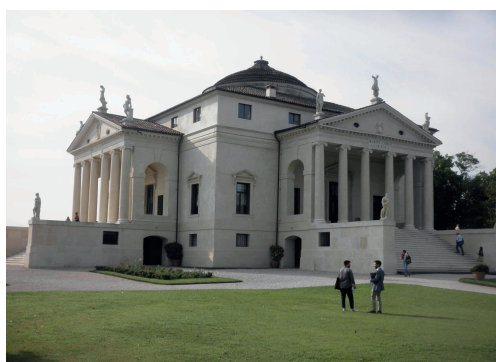
Imágenes 18 y 19. Villa Capra

Las imágenes 18 y 19 muestran la excelsa fachada de esta estupenda obra (Cedeño, 2023).