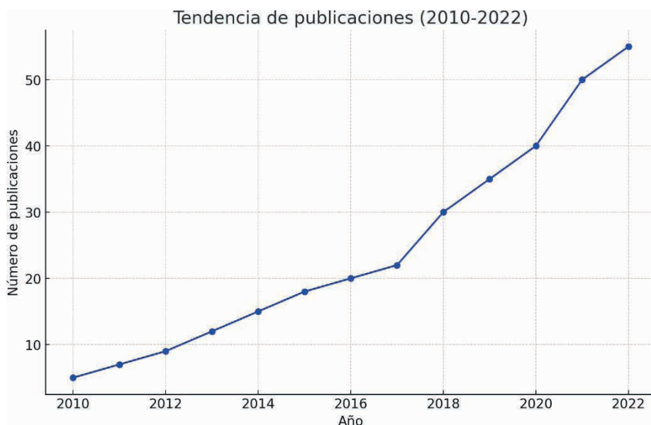
Figura 2: Tendencia e publicaciones (2010-2022)