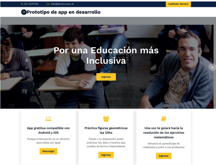
Figura 1. Página principal del prototipo accesible desde la URL: http://santimonia.org/accesibilidad

Se utilizó el framework Paper.js utilizado en la programación de scripts de gráficos vectoriales, eligiendo el lenguaje de programación orientado a objetos Javascript que por ser un lenguaje de programación interpretado que puede funcionar en la gran mayoría de los navegadores sin necesidad de instalación y porque es sencilla su adaptación a dispositivos móviles mediante, por ejemplo, el uso del framework Apache Cordova también de software libre.