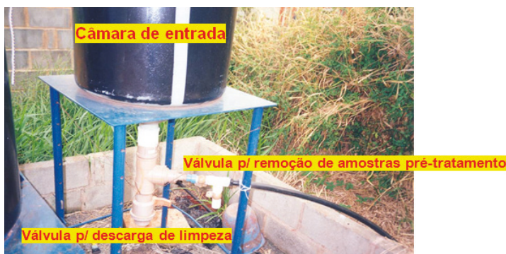
Figura 3 - Visão do pré-filtro.

O sistema de válvulas coletoras de amostras pode ser observado pela figura 3, sendo constituído em PVC e que permite no pré-filtro e nos filtros subsequentes retiradas de água residuária e também para processo de destarte de água quando há necessidade de limpeza nos três filtros.