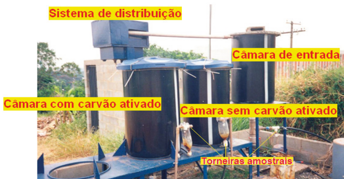
Figura 1 – Sistema de Filtração lenta da FEAGRI/UNICAMP.

Na figura 1 observa-se uma visão geral do complexo de filtração lenta montado.