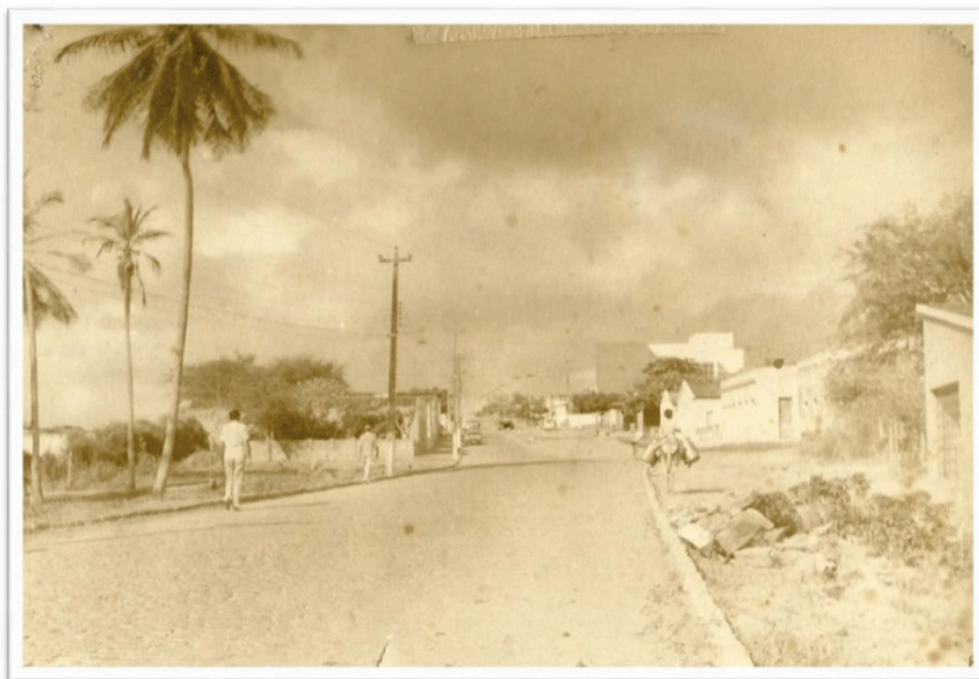
Imagem 03: Rua Zeferino de Paula, posterior ao serviço de calçamento.