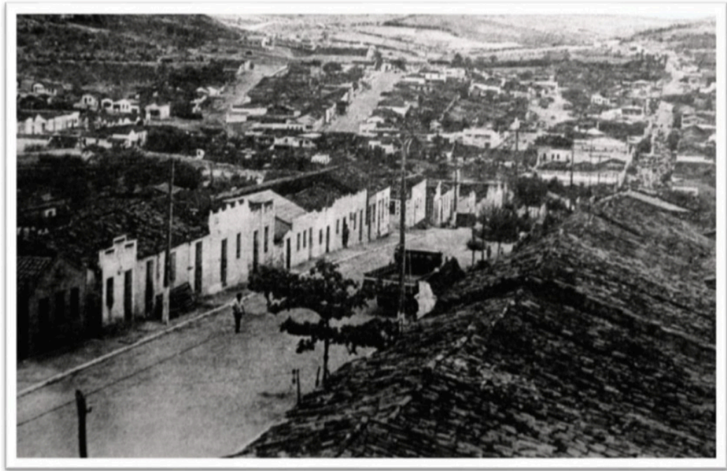
Imagem 08: Vista panorâmica da Cidade de Aroeiras (década de 1980)