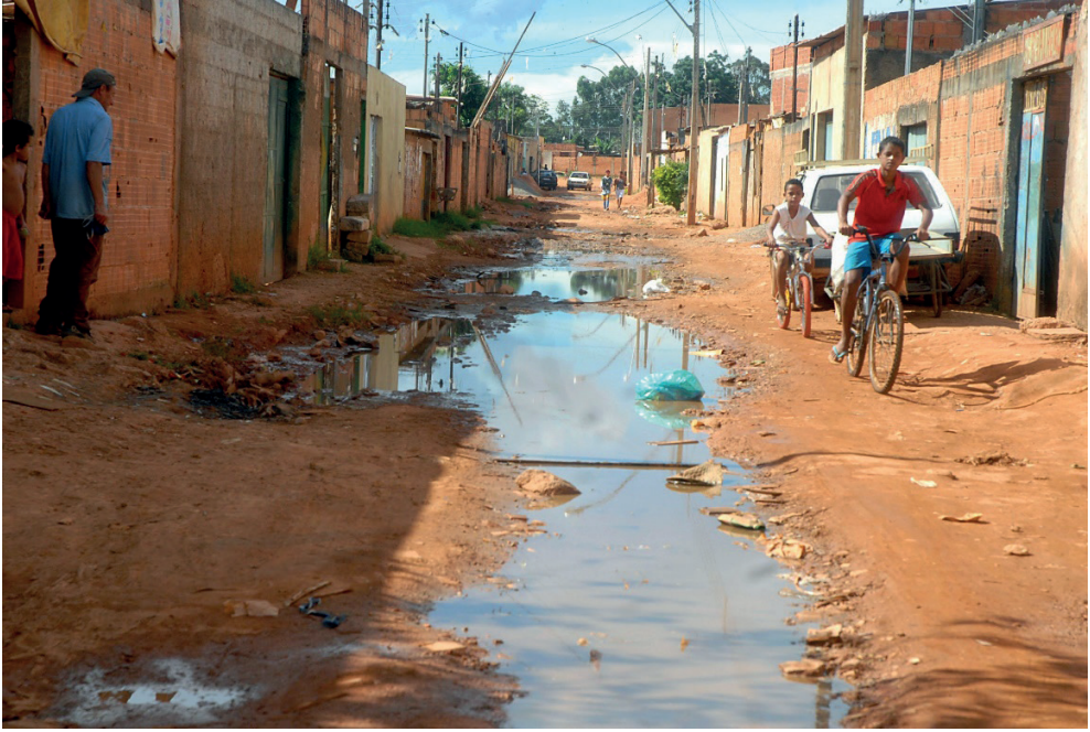
Figura 2 - Aglomerado subnormal com saneamento básico precário