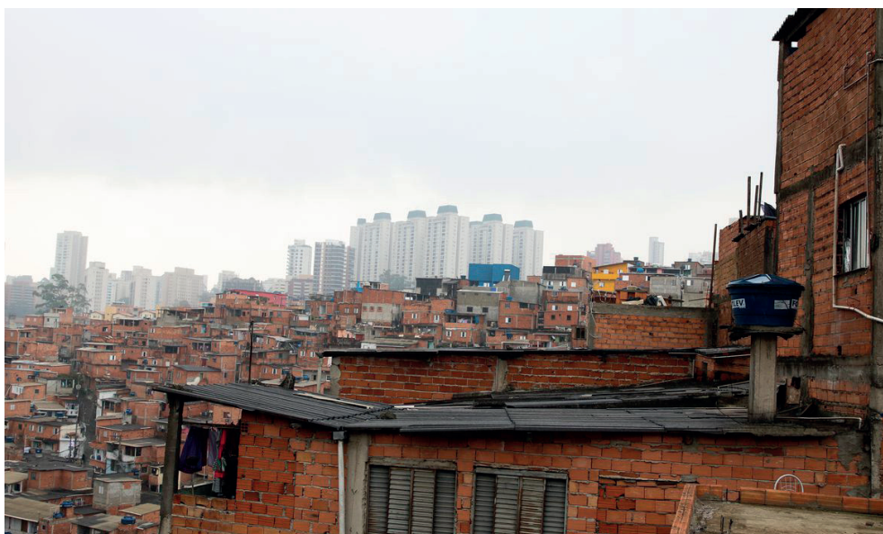
Figura 3 - Favela Paraisópolis na cidade de São Paulo

A análise dos aglomerados subnormais no estado de São Paulo oferece uma visão clara das deficiências no fornecimento de saneamento básico, destacando a difícil realidade de comunidades que carecem do essencial para uma vida digna. As famílias que residem nessas áreas enfrentam condições extremamente precárias, com desafios significativos no acesso aos serviços essenciais de saneamento, principalmente no tratamento de esgoto. Essas circunstâncias sinalizam a necessidade iminente de abordar as questões de saneamento nessas comunidades e comprovam a disparidade socioeconômica, como ocorre, por exemplo, na Favela Paraisópolis (Figura 3).