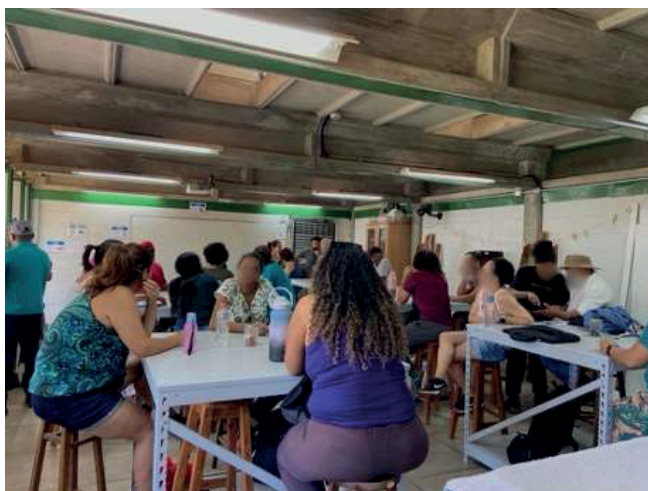
Figura 1: Atividade em laboratório para reconhecimento dos resíduos em diferentes estágios de decomposição

Para avaliação das atividades foi distribuído aos participantes uma cartilha com perguntas a serem preenchidas por eles. As cartilhas foram recolhidas ao final do curso e fez-se a análise de conteúdo das respostas.