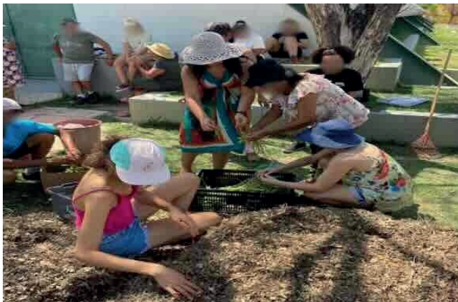
Figura 2: Atividade prática durante o curso “montagem da composteira”

Dinâmicas são caracterizadas por elementos que lhe são definidores: ações de curta duração que, ao fazer uso de uma técnica própria, específica, induz motivação e envolvimento. Os objetivos das dinâmicas podem variar em uma ampla gama: podem ir de atividades de “aquecimento”, em que os participantes são induzidos a um comportamento integrador e de mútua aproximação, até o aprendizado de alguma habilidade passando por momentos de reflexão e de mudança atitudinal (DA SILVA, 2021).