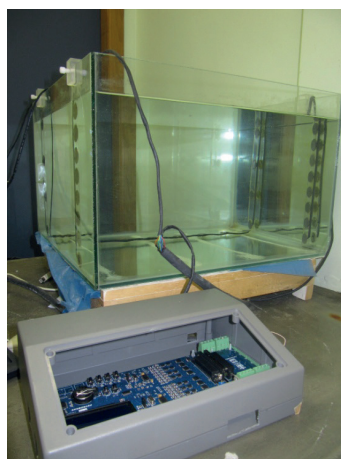
Figura 1: Placa de aquisição de dados e tanque utilizado para os testes.

no contorno do plano avaliado dezesseis eletrodos. Os testes do método foram feitos em uma primeira etapa para duas situações distintas: um objeto condutor e um objeto isolante imersos em água. O aparato experimental é apresentado na Figura 1.