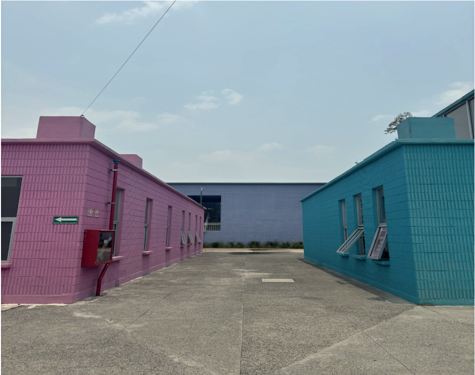
Figura 1. Utopía Meyehualco, Iztapalapa CDMX, tomada el 29 de mayo del 2024.