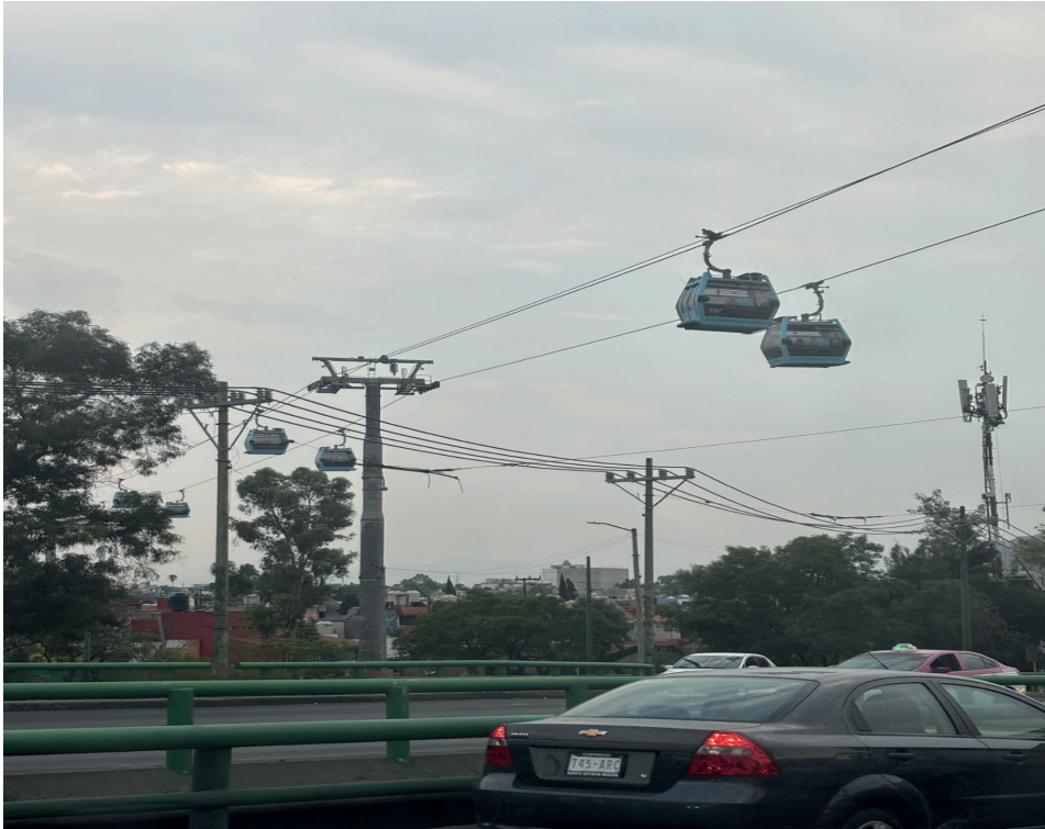
Figura 7. Cablebus Utopía Meyehualco. Mayo 2024.