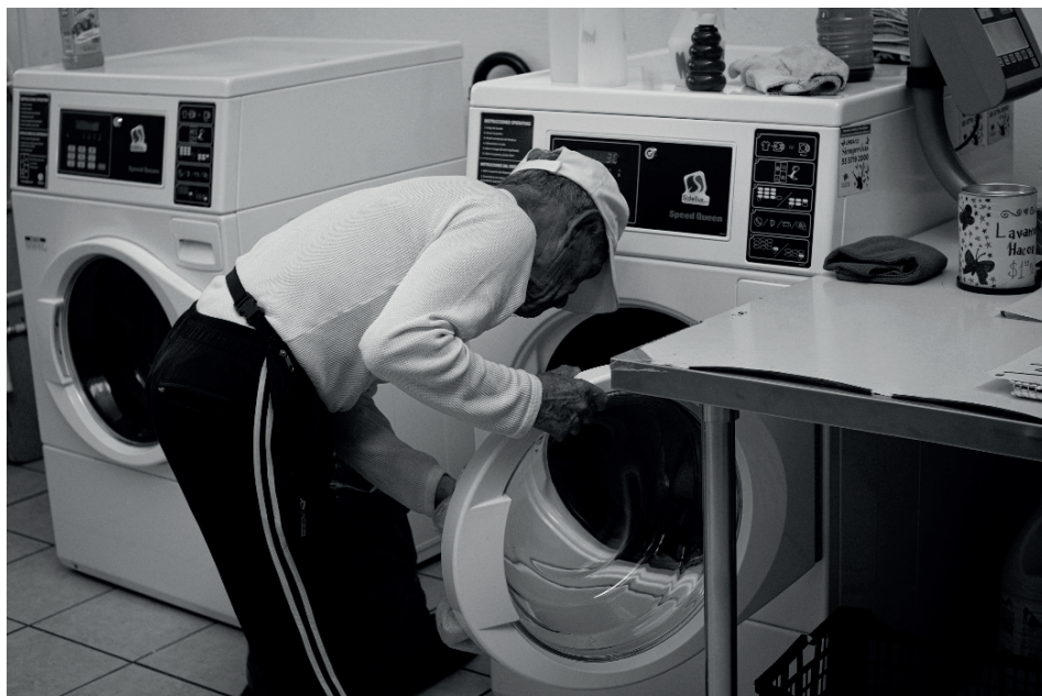
Figura 5 Área de lavadoras y cuidados domésticos, mayo 2024

También se accedió a un espacio con un ambiente totalmente distinto, dedicado a los cuidados del hogar y personal. La arquitectura es austera, plafones y muros blancos, pero funcional, la gente es la que le da el sentido al espacio. Lo más destacado son los espacios donde los habitantes oriundos de la zona pueden acceder a un servicio, que para muchos es un lujo, al lavar y secar sus vestimentas con el mínimo esfuerzo, mujeres y hombres comparten este espacio, por solamente un peso, lo anterior conlleva a una ruptura de los hombres hacia los trabajos domésticos, es aquí donde se puede aprender sin diferencia de género a peinar, planchar, lavar, barrer, trapear y todas esas actividades que no son remuneradas.