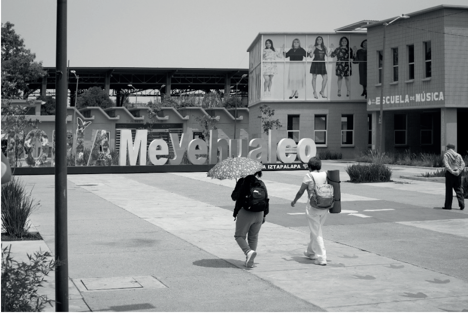
Figura 3. Utopia Meyehualco. Mayo 2024

El guía dio acceso al primero de estos espacios, (No es un secreto que la alcaldía ha sufrido un tipo de violencia hacia un sector en particular, las mujeres nacidas de este lado la ciudad, frecuentemente, sufren de acciones en su contra que ya se han normalizado), este espacio es dedicado a ellas, “La casa de las siempre vivas”, multidisciplinario, está al servicio de mujeres y niñas quienes puede acudir a plantear problemas de violencia de género y tener acompañamiento psicológico y legal.