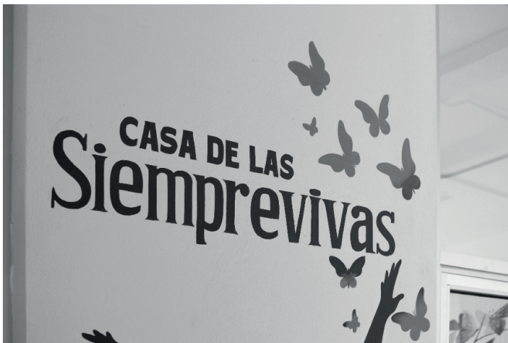
Figura 4. Espacio de las siempre vivas Utopia Meyehualco.

El guía dio acceso al primero de estos espacios, (No es un secreto que la alcaldía ha sufrido un tipo de violencia hacia un sector en particular, las mujeres nacidas de este lado la ciudad, frecuentemente, sufren de acciones en su contra que ya se han normalizado), este espacio es dedicado a ellas, “La casa de las siempre vivas”, multidisciplinario, está al servicio de mujeres y niñas quienes puede acudir a plantear problemas de violencia de género y tener acompañamiento psicológico y legal.