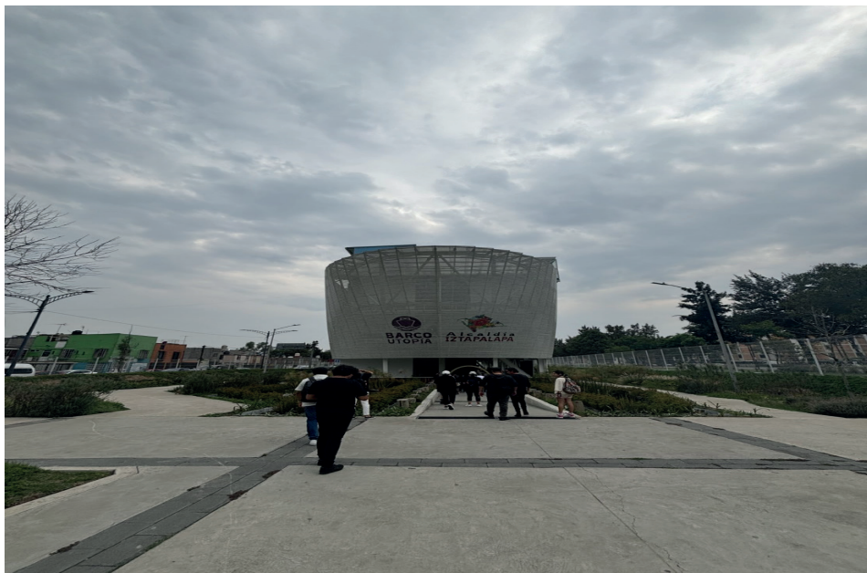
Figura 5. Barco Utopía, en Iztapalapa, mayo 2024.

Se visitó otro complejo del mismo programa “El Barco UTOPIA” una construcción con la forma simulada de un mar de vehículos que se movilizan lentamente, como mareas en un atardecer. La estancia fue más breve, su dimensión no es tan grande como la anterior, y carece del lado deportivo que es insignia de la UTOPIA Meyehualco. Aquí se encontró más el aspecto de un museo, pues fue una serie de habitaciones con información acerca del cambio climático. El edificio de forma peculiar cuenta con 3 niveles y una terraza a la cual no fue posible acceder. En el segundo nivel, hay un museo que busca prevenir el abuso infantil, con interacciones en las imágenes, que fomentan la información clara y concisa para padres y niños dándoles herramientas para prever, o en un desafortunado caso, afrontar una situación grave si el mal ya fue hecho. En el mismo nivel hay aulas de talleres, y un cine. En el otro nivel y ultimo que visitamos, se encontraba el espacio insignia de esta UTOPIA y un acuario digital. Son tres salas con muchas animaciones e información, la última de ellas un espacio con una triple altura, repleta de animaciones e invitándote a sacar al niño interior, para brincar, correr, tocar y jugar.