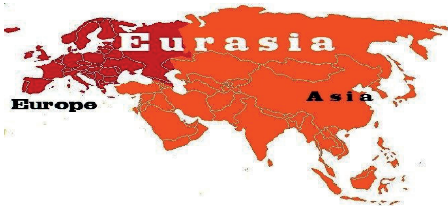
Cuadro 2.- Eurasia