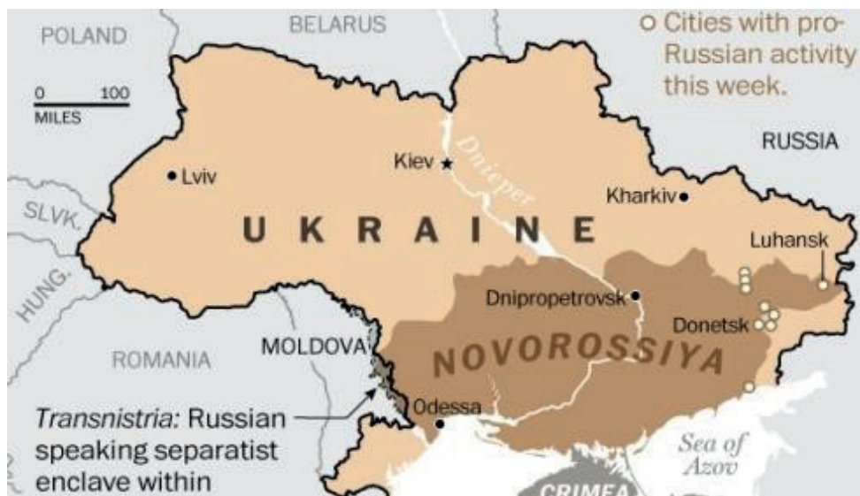
Cuadro 5.- Donetsk y Lugansk en Nueva Rusia

Por eso era muy importante para Rusia - argumenta la dirección política rusa - que aquellos territorios y regiones donde los rusos viven, forman y representan la mayoría de los habitantes volvieran al país madre. Y estas son las dos provincias de la región de Novorossiya (Nueva Rusia) de Donbás: Donetsk y Lugansk. La historia ya es conocida. Las dos provincias con la ayuda de Rusia declararon su separación y salida de Ucrania. Y antes de los tres días de la invasión rusa, el 21 de febrero de 2022, Rusia reconoció a la República Popular de Donetsk y a la República Popular de Lugansk, dos estados autoproclamados en la región de Donbás en el este de Ucrania, y envió tropas a esos territorios. Al día siguiente, el Consejo de la Federación de Rusia autorizó por unanimidad a Putin a utilizar la fuerza militar fuera de las fronteras de Rusia. El 24 de febrero, Putin anunció —en un mensaje televisado— una «operación militar especial» en el territorio de Donetsk y Lugansk; los misiles comenzaron a impactar en varios lugares de Ucrania, las fuerzas terrestres rusas entraron en el país dando inicio la guerra entre Ucrania y Rusia.