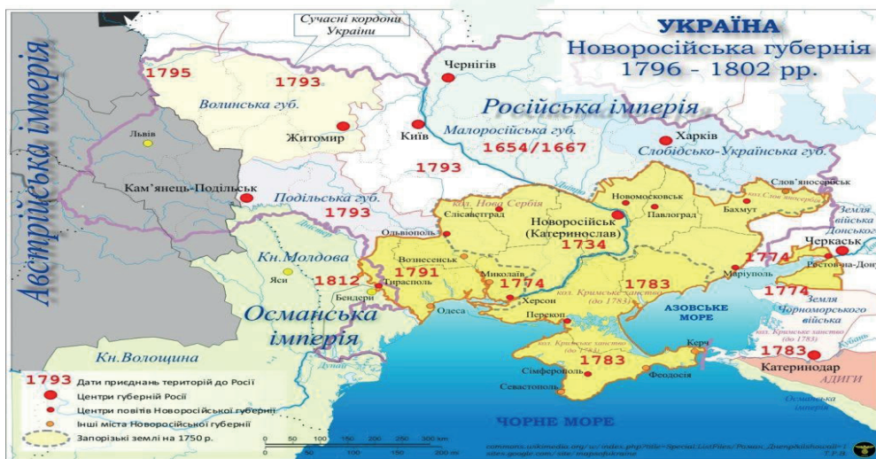
Cuadro 4.- Nueva Rusia (Novorossiya)

Después de la Guerra contra el Imperio Ottomano, en la segunda mitad del siglo XVIII., Rusia se ocupó la Península Crimea y los territorios alrededores del Mar Negro, los que denominan hoy en día Nueva Rusia (Novorossiya).