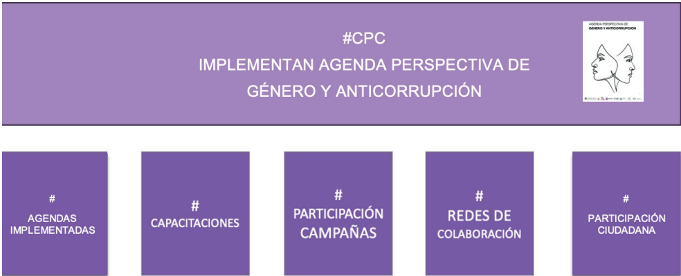
Figura 4. Evaluación de la Agenda Perspectiva de Género y Anticorrupción (APGA).

La implementación de esta Agenda Perspectiva de Género y Anticorrupción nos permitirá contribuir con políticas nacionales y estatales anticorrupción y, a través de las metas, medir su impacto.