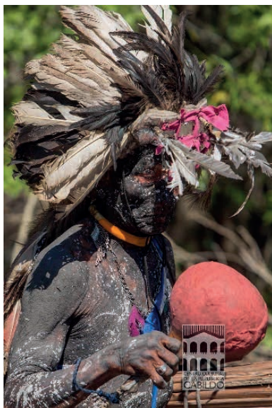
Figura 4: Manifestaciones culturales, prumajes, danzas, cosmovisión de los Yshir.

Los atractivos culturales y naturales que cuenta la ciudad pueden promover el turismo cultural y ecológico, gracias a la presencia de la población originaria (Yshir Ebytosos), que habita en el barrio Virgen Santísima, ellos poseen una cultura ancestral, una compleja cosmología y simbología Yshir muy valiosa, también su lengua guarda conocimientos del territorio (patrimonio intangible). Por ello se vuelve imperativo preservar su cultura. Permanentemente son amenazados por la influencia de la inversión privada, donde son explotados y han perdido mucho de sus territorios ancestrales y sus costumbres a causa de ello.