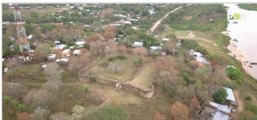
Figura 3: Vista aérea del Fuerte Borbón.

La ciudad se encuentra rodeada de inmensos humedales del Gran Pantanal, el casco urbano y a su vez histórico, se ubica en una zona elevada al resguardo de las inundaciones, entre los tres cerros, que son además de gran valor geológico y ambiental.