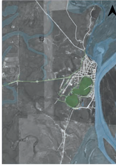
Figura 10: Mapa de la ciudad.