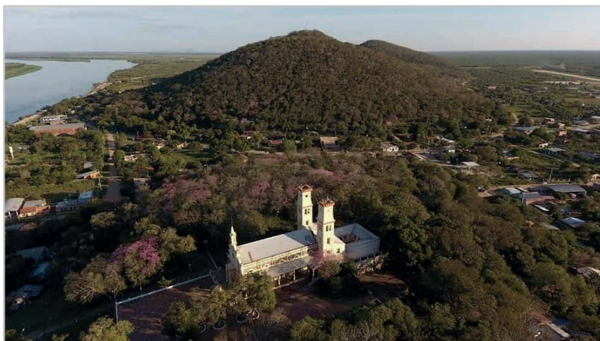
Figura 6: Vista general de la ciudad, edificios de valor patrimonial y recursos naturales.

La principal atracción para el turista es el disfrute del paisaje, por ello se debe valorizar aún más el entorno natural que rodea a la ciudad, generando espacios para la contemplación.