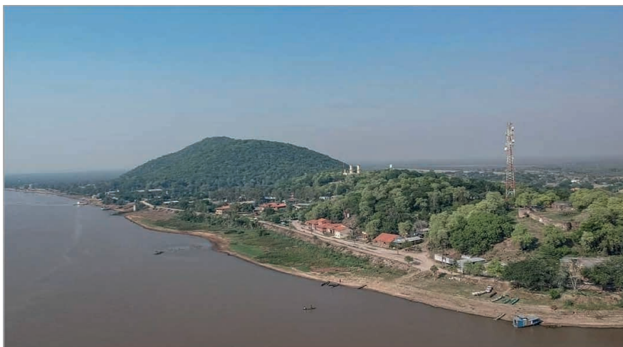
Figura 1: Vista general de la Ciudad de Fuerte Olimpo, sobre el río Paraguay, Departamento del Alto Paraguay.

Este artículo surge como parte de la investigación de una tesis del Doctorado UNNE DAU, donde la autora investiga a la ciudad de Fuerte Olimpo y sus alrededores, su proceso de ocupación del suelo como área postergada de Paraguay, donde el principal objetivo es generar una propuesta de Ordenamiento Territorial integral para su desarrollo adecuado.