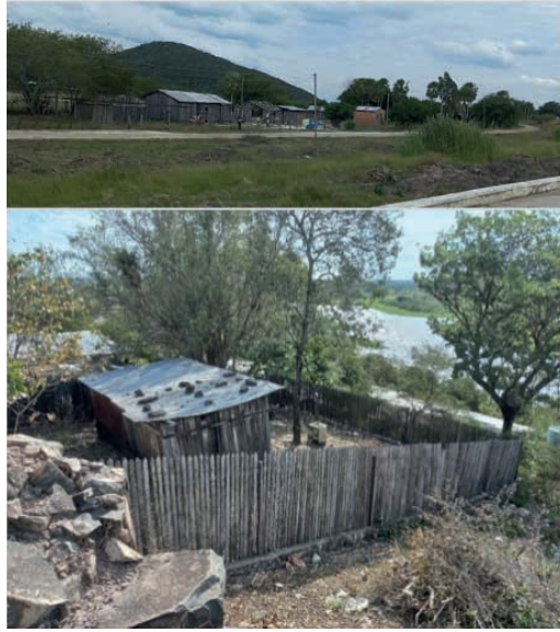
Figura 11: Viviendas que se constituyen ejemplos de Patrimonio vernáculo construido en la ciudad de Forte Olimpo.