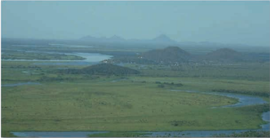
Figura 7: Paisaje natural del ecosistema Pantanal. Dpto. del Alto Paraguay.