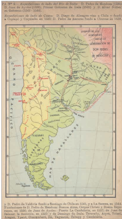
Figura 2: Itinerario de la expedición de Juan de Ayolas en 1537.