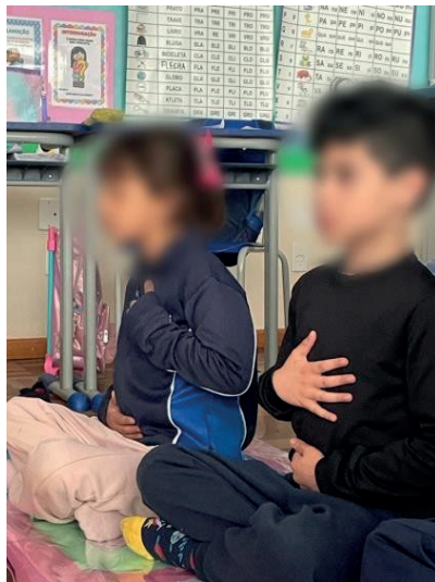
Figura 2 - Prática de respiração