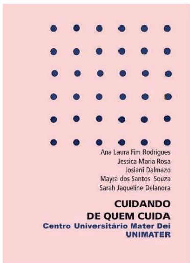
Figura 1 – Manual de Autocuidado “Cuidando de Quem Cuida”.

Já no segundo encontro, realizou-se uma roda de conversa, durante a qual foi disponibilizado o manual “Cuidando de Quem Cuida” (conforme consta na figura 1) e, desenvolvido um momento de interação e compartilhamento de experiências entre os participantes, além da confecção da “Árvore do Acolhimento”, uma instalação artística produzida a partir de mensagens de apoio em conjunto ao público do projeto (conforme consta na figura 2). Por fim, a aplicação de uma pesquisa de satisfação (questionário preenchido de forma anônima pelos participantes para a descrição das sensações durante a realização das atividades - o qual serviu posteriormente para a análise dos resultados das ações por parte das acadêmicas).