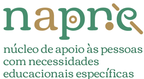
Figura 1: Logo do Núcleo de Atendimento à Pessoa com Necessidades Específicas

O ingresso nos cursos superiores em escolas da Rede Federal se dão via Sistema Único de Seleção (SISU) a partir do Exame Nacional do Ensino Médio (ENEM), portanto só identifica o aluno na hora da matrícula, não há nenhum contato anterior, pois, todo o processo de seleção fica centralizado no SisU.