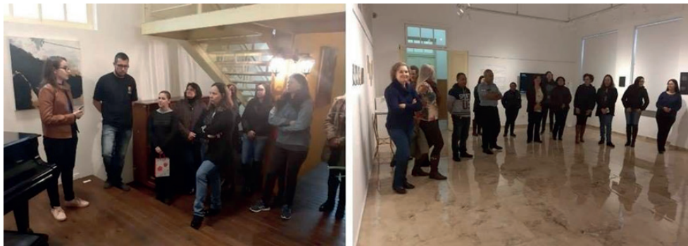
Figura 2 - Inauguração do Espaço Acervo PROEX- 10' na Galeria