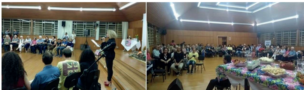
Figura 1 - Evento de abertura/Lançamento

Foram reuniões entre a coordenação e acadêmicos/estagiários e acadêmicos voluntários para a distribuição de tarefas e a execução do evento. Neste evento, participaram da organização a coordenação, os 3 estagiários e 5 acadêmicos voluntários do Curso de Licenciatura em Artes Visuais. No dia do evento, além dos envolvidos, houve a participação de escritores, artistas plásticos, comunidade em geral, acadêmicos e professores de vários cursos, como Letras, Turismo, Jornalismo e Artes Visuais. A participação contou com 250 pessoas, entre convidados e comunidade