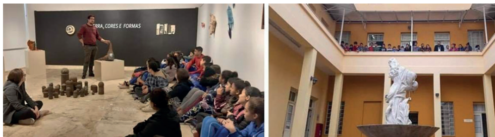
Figura 5 - Exposição Terra, cores e formas / Visitação ao prédio PROEX

Percebemos, então, o quanto é importante a preparação e, ao mesmo tempo, o aprendizado desses acadêmicos, para que, na prática das suas funções pedagógicas, tenham a responsabilidade de despertar em seus alunos o olhar crítico sobre a Arte e sobre o mundo.