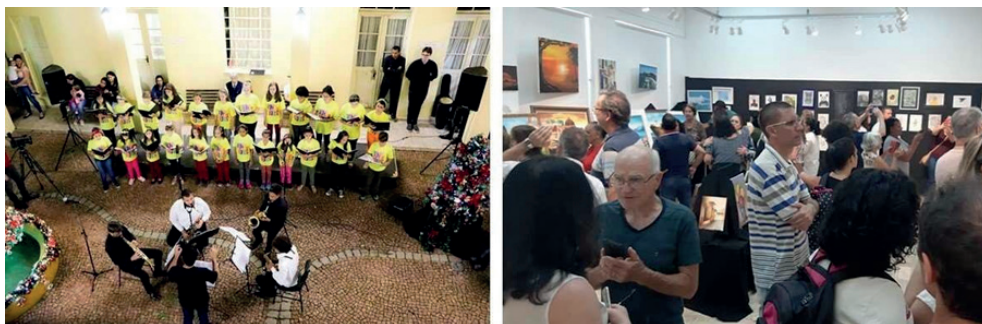
Figura 4 - Coral Tons e Cores/ VI Exposição Da Técnica à Arte

A Cantata de Natal, realizada pela Galeria de Arte, aconteceu em sua 3ª edição. Contou com as apresentações do grupo Coro em Cores (Figura 4), Coro Infanto-juvenil Tons e Cores e convidados. Teve também a participação do Coral de Vozes. Para compor o evento, tivemos a abertura da VI Exposição Da Técnica à Arte, na Galeria de Arte PROEX, com produções artísticas realizadas durante o ano de 2019 pelos alunos/artistas dos cursos de desenho e pintura da Divisão de Assuntos Culturais.