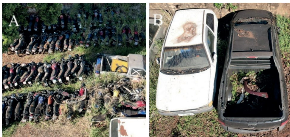
Figura 1 – (A) área com motos e entulhos, e ( B): automóvel com água na caçamba

Seguindo o plano de voo livre formulado na metodologia, no dia 7 de junho de 2023, iniciou-se os voos com o drone no recorte espacial desta pesquisa no qual se limitou a dois setores dos bairros da cidade de Medianeira-PR, Parque Independência e Bairro Itaipu, tendo reconhecimento dessas áreas como potencial para a proliferação do mosquito. O primeiro voo foi realizado no 14º Batalhão de Polícia Militar localizado no Bairro Itaipu, no qual foi capturado fotografias de locais de difícil acesso e com risco a essa proliferação (Figura 1-A e B).