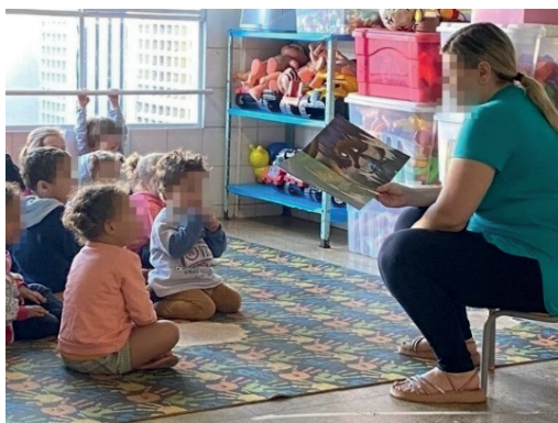
Figura 03: Contação de história

Nós, estagiários, mais que depressa, também ficamos interessados e atentos durante a contação dessa interessante história que desfaz a ideia de o lobo ser uma figura maldosa.