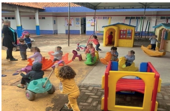
Figura 02: Recreação no parquinho

Prontos para mais diversão, o parquinho é a recreação final antes do almoço e do momento da soneca.