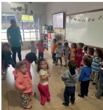
Figura 01: Ensaio de quadrilha

O carpete está cheio delas, de olho para a televisão. O vídeo que se passa é sobre a história do “Arraiá” 4 . Para fugir da simples exposição do vídeo, a professora elicit os trajes tradicionais vistos na televisão e chama a atenção para a ausência de choro: “Tem alguém chorando no arraiá?! Não! É momento de se divertir e não precisa chorar”. Essa ação lidera o momento seguinte de ensaio de quadrilha dentro da sala de aula, em círculo, como visto na imagem a seguir: