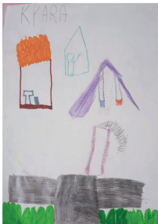
Figura 4 - Fonte: Fotografia da autora (2023)