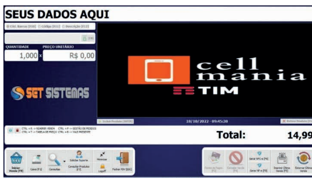
Figura 2: Sistema de caixa da empresa.

O relatório para conferência de estoque é fornecido pelo sistema de informações da empresa e contém o código e a descrição de todos os produtos existentes na empresa, seus valores, a quantidade do sistema e um campo para atualizar a quantidade correta conferida. A seguir apresenta-se os sistemas de caixa e de informações utilizados pela empresa.