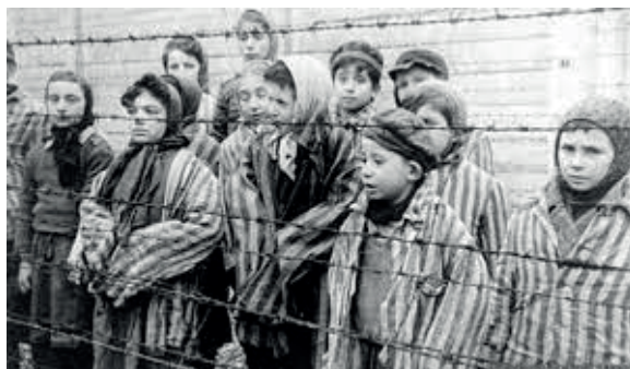
Figura 7: Auschwitz

No dia 27 de janeiro de 1945 as tropas soviéticas encontraram Auschwitz, local conhecido por ser o maior complexo de extermínio.