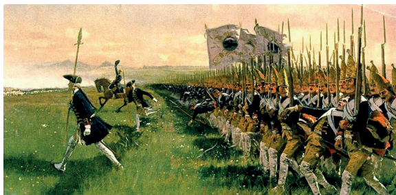
Figura 2: Quadro de Carl Röchling

A guerra dos 7 anos tem grande importância na história dos combates mundiais pois influenciou, a colonização europeia na América e a independência estadunidense e para os historiadores ela é considerada o primeiro grande conflito mundial pois suas disputas ocorreram em várias partes do planeta e suas consequências foram mundiais.