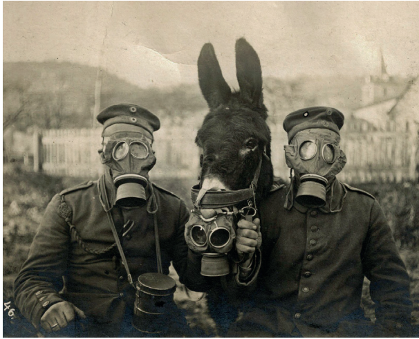
Figura 4: Guerra química