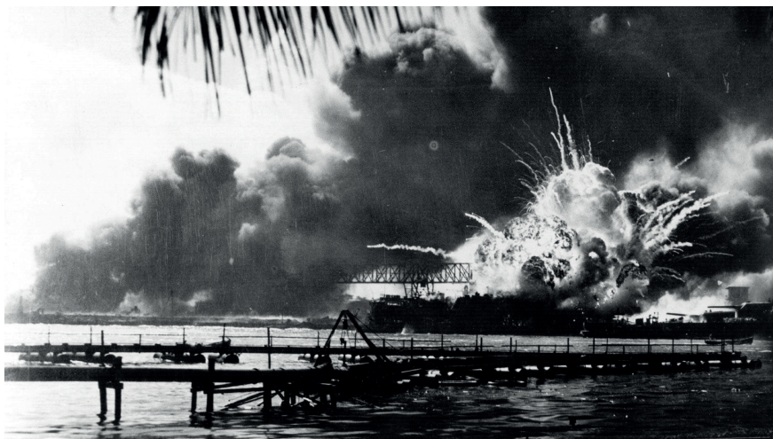
Figura 6: Imagem de pearl harbor durante ataque kamikaze das forças aéreas japonesas

No dia 7 de dezembro de 1941 pouco antes das 8 horas o japão atacou de surpresa a base naval dos estados unidos, ataque que resultou em mais de 2 mil mortos para a marinha americana e por consequência a entrada dos estados unidos na guerra, também um dos motivos pelo lançamento das bombas nucleares no japão