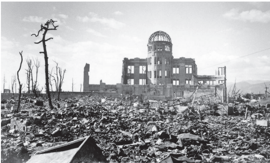
Figura 5: Foto após ataque de bomba nuclear em Hiroshima

Às 8h15 a bomba denominada little boy, com 75 quilos de urânio foi lançada sobre a cidade de Hiroshima a mais de 10 quilômetros de altura demorando 43 segundos até a explosão de tudo em um raio de 2 mil metros em sua volta matando 140 mil pessoas.