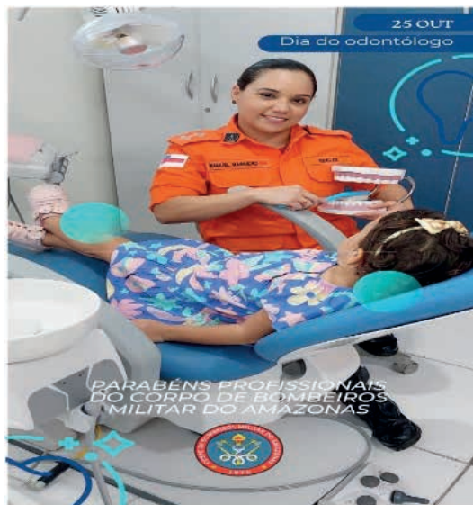
Figura 04: Odontologia nas Forças de Segurança