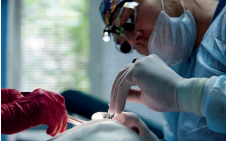
Figura 1: Odontólogo atuando