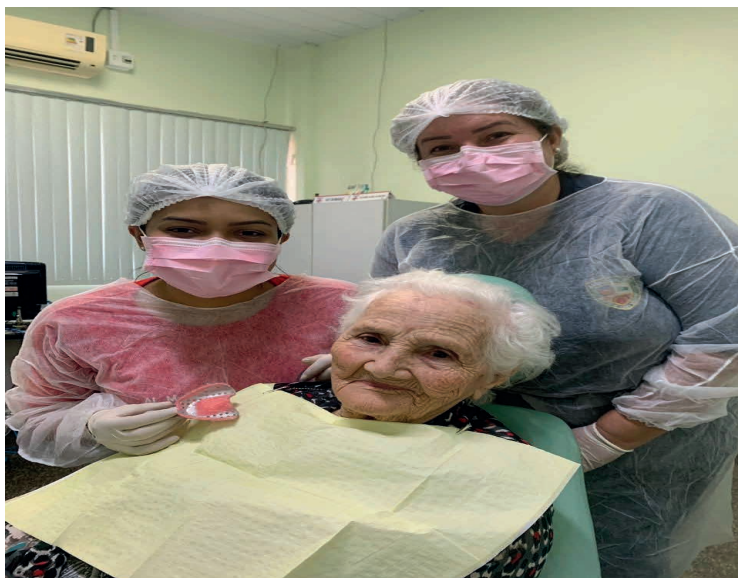
Figura 07: Cuidado Odontológico Humanizado

Cáries e doenças gengivais são comuns e podem ser agravadas pelo estresse e hábitos alimentares no ambiente de trabalho. A má alimentação, consumo excessivo de café e falta de higiene bucal adequada podem contribuir para o desenvolvimento dessas condições. Funcionários que sofrem de cáries e doenças gengivais podem experimentar absenteísmo e queda na produtividade (LEITE et al, 2019).