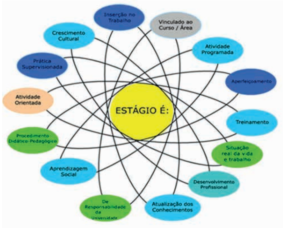
Figura 02: Dinâmica do Estágio