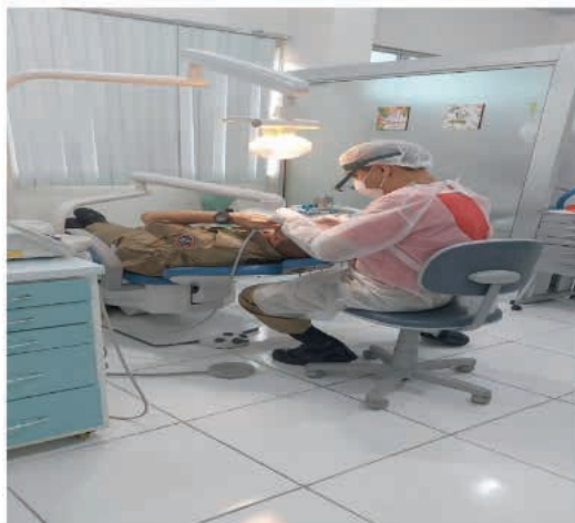
Figura 05: Atendimento em Odontologia na Corporação