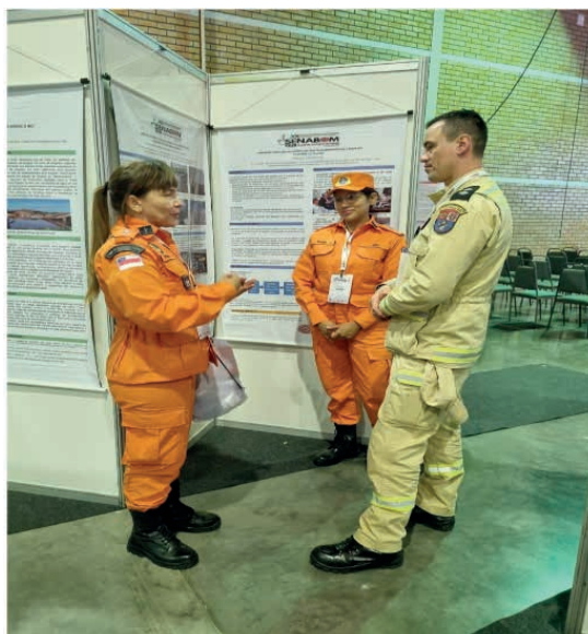
Figura 03: Divulgação Científica do CBMAM

A comunicação eficaz com os pacientes é uma habilidade crucial para profissionais de odontologia. Durante a prática odontológica, os profissionais exercem a habilidade de se comunicar com pacientes de diversas origens e faixas etárias, explicando procedimentos, discutindo opções de tratamento e aliviando ansiedades. A construção de relacionamentos empáticos com os pacientes promove uma experiência positiva de tratamento, aumentando a aderência ao tratamento e a satisfação geral do paciente de maneira holística.