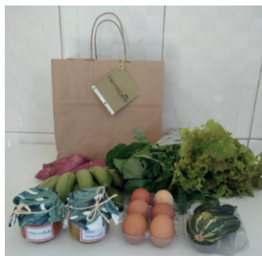
Figura 02: Sacola Agroecológica

Na região afastada da área rural, onde se situam os bairros do Guanhanhã, Bananal e Cossoca, as produtoras se reuniram e criaram um Grupo de Consumo Consciente pelo aplicativo Whatsapp onde divulgam e entregam sacolas, contendo duas frutas, duas verduras, tubérculos e ovos a preços acessíveis, podendo o consumidor receber essas sacolas toda semana, quinzenalmente ou uma vez por mês.