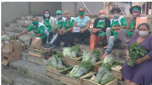
Figura 01: Caixas Agroecológicas da Feira do Produtor.

A Feira do Produtor Rural é um espaço hoje que propicia o desenvolvimento de relações socioculturais e educativas. Nela é possível conhecer os agricultores, sua família, seus hábitos, histórias. técnicas de plantio, enfim, é um lugar onde se resgatam valores, crenças e possibilita a troca de informações e conhecimentos, mas principalmente sobre alimentação, seus benefícios para a saúde e sobre qualidade de vida.