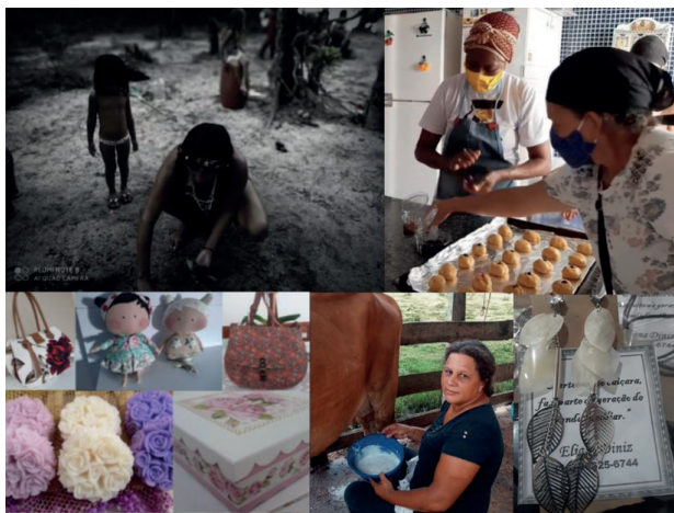
Figura 03: Economia Solidária e Lei Aldir Blanc.

No movimento de transição solidária também é possível perceber como a EcoSol pode interagir com outras políticas públicas e nesse contexto foi realizado um trabalho de pertencimento, divulgação e atuação na captação de recursos da Lei Aldir Blanc (Figura 03) que atendia inicialmente os trabalhadores da Cultura mas que em Peruíbe se estendeu aos coletivos de Economia Solidária abrangendo a cultura do campo, a cultura indígena, caiçara, tradições quilombolas, artesanato dos coletivos solidários, dentre outros.