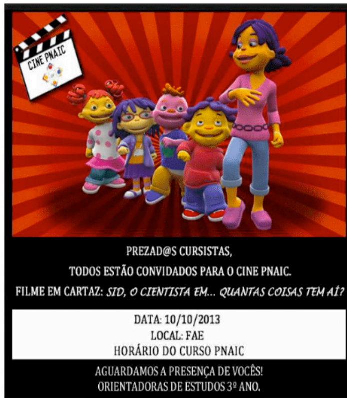
Figura 4 - Convite do Cine PNAIC.