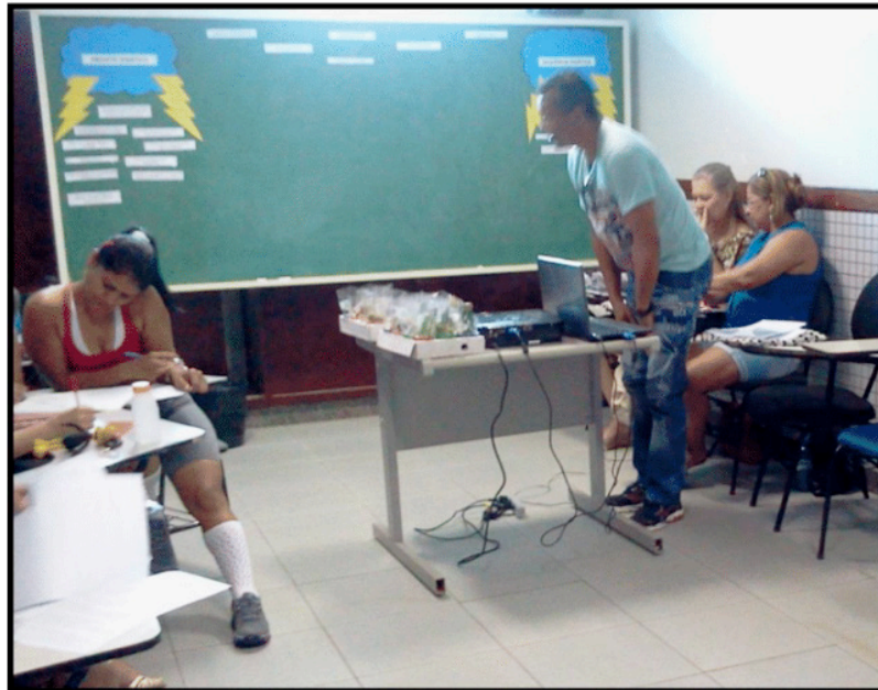
Figura 2 - Construção coletiva com os professores cursistas.