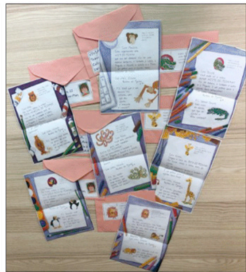
Figura 5 - Máscaras e cartinhas dos animais.