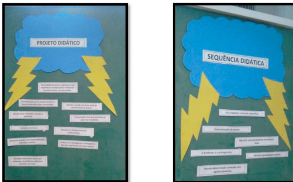
Figura 3 - Conceitos de projeto didática e sequência didática.