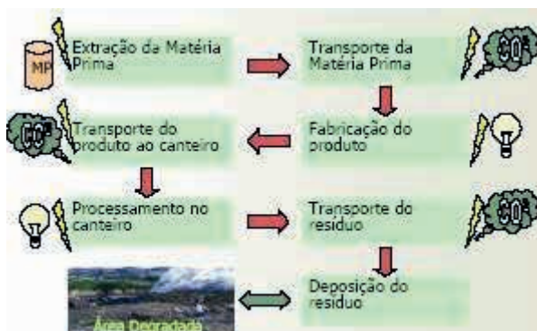
Figura 1. Impacto ambiental da construção civil

Na Figura 1 são apresentados os impactos ambientais gerados pela construção civil, que vão desde a extração da matéria prima até a deposição adequada dos resíduos.