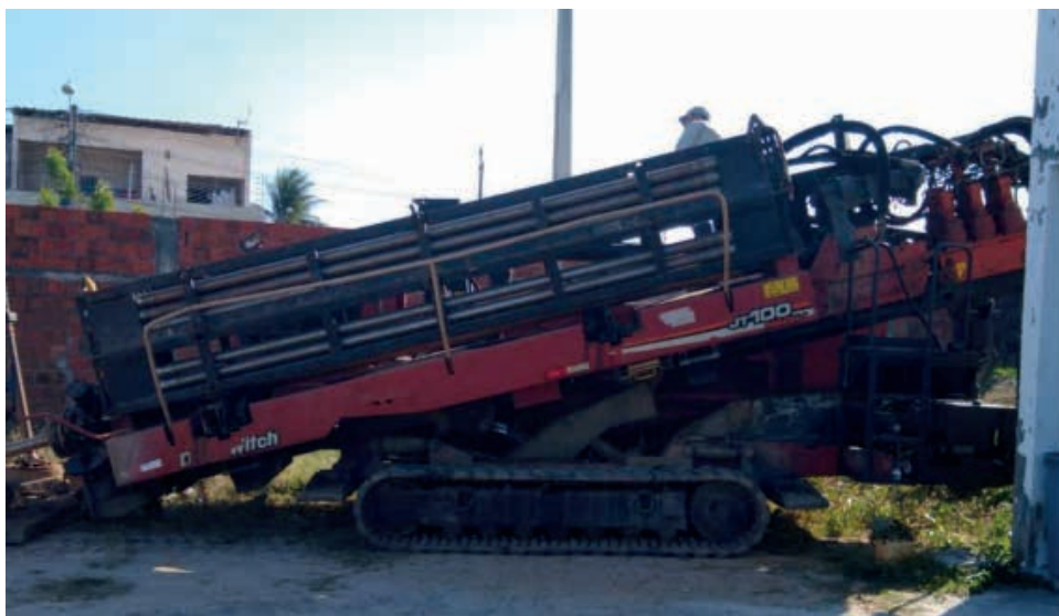
Figura 2 - Instalação da máquina perfuratriz

A escavação mecânica dos poços de apoio e serviço foi realizada após o escoramento do tipo blindado devido à grande quantidade de água no lençol freático, sendo necessário a realização do rebaixamento. Posteriormente, após a instalação da perfuratriz, dá-se continuidade com a cravação das hastes de ferro no solo sendo acompanhada pelo navegador para que não ocorra desvios durante todo o percurso da tubulação definidos em projeto, processo demonstrado nas figuras 2 e 3.