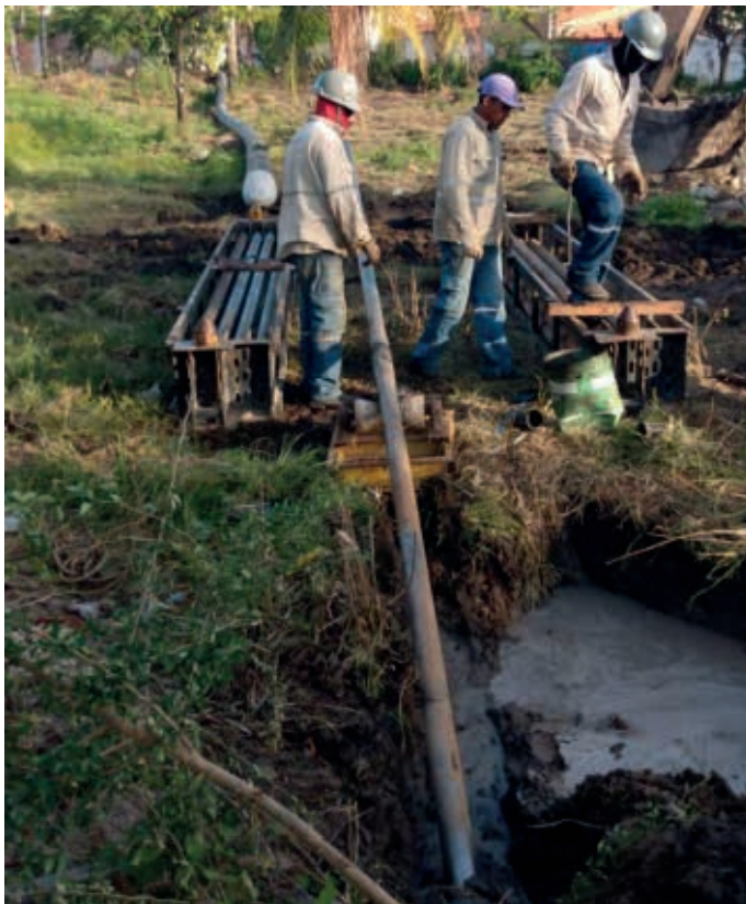
Figura 3 – Retirada das barras de ferro após completar o trajeto

Determina-se a soldagem dos encontros dos tubos PEAD para alcançar a extensão necessária de assentamento, visto que o comprimento do tubo é originalmente de 6 m, trabalho este que foi realizado concomitantemente com a introdução do alargador no trecho. Por fim, é injetado o tubo nos poços de visita de DN 1200 mm à montante e jusante e feito o descarte da tubulação de sobra.