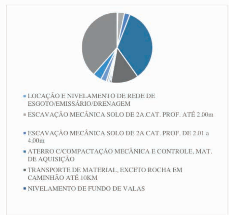
Figura 4 – Itens mais relevantes referentes a execução de rede coletora por método convencional