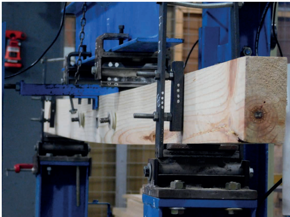
Figura1: Viga durante el ensayo a flexión según norma IRAM 9663