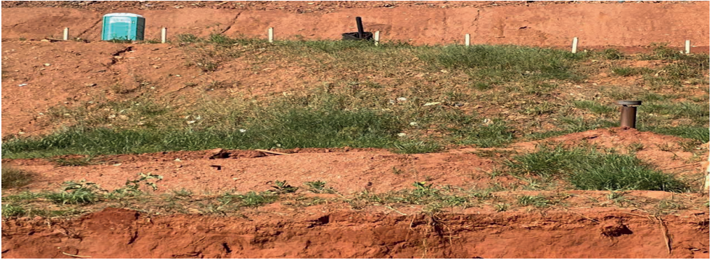
Figura 3: Talude com recobrimento de LETA apresentando o crescimento de gramíneas.