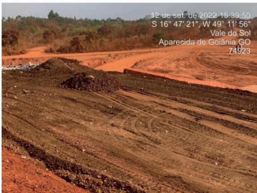
Figura 2: LETA utilizado como material de recobrimento.

Rocca (1993) apud Prim (2011) e Qasin e Chiang (1994) apud Prim (2011) descrevem que a porcentagem passante na peneira #200 (peneira com abertura de 0,074 mm), precisa ser maior que 30%, para atender os requisitos mínimos para cobertura de aterros. Em ambos os casos o LETA e solo apresentam valores superiores a 30% de material passante na peneira #200, validando, do ponto de vista geotécnico, tanto o uso do solo como do lodo, para cobertura de resíduos.