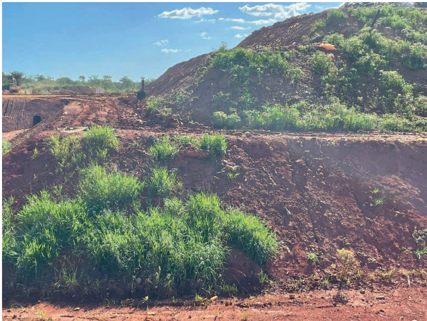
Figura 4: Talude com recobrimento de LETA apresentando o crescimento de gramíneas.

Com relação ao desempenho geotécnico do LETA, observou-se in situ , que não houve fissuras ou trincas nos locais onde o material foi utilizado como material de recobrimento. Ressalta-se que o empreendimento realiza a raspagem do solo à medida que há o avanço do maciço de lixo, ou seja, o LETA não é aterrado.