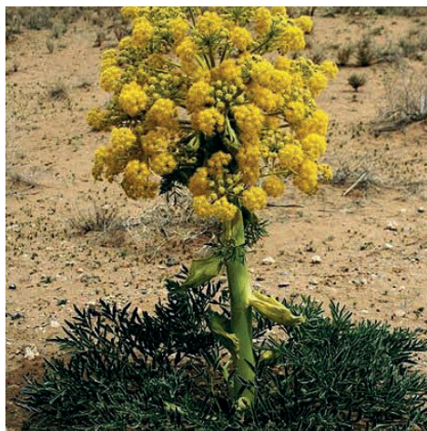
Figura 1: Ferula Foetida (Ferula Assa-fétida)

A assa-fétida ( Ferula foetida ) ( Figura 1 ) é uma planta medicinal também conhecida como assa-fétida, esterco-do-diabo, férula e funcho-gigante. O óleo essencial extraído da mesma é retirado de uma resina obtida principalmente do caule e raízes vivas da planta (MAHENDRA; BISHT, 2012). Dentre as propriedades do assa-fétida, encontramos efeitos anti-inflamatórios, antisséptico, antiespasmódico, imunostimulante, antibacteriano e potencial antiviral (LASZLO, 2021a).