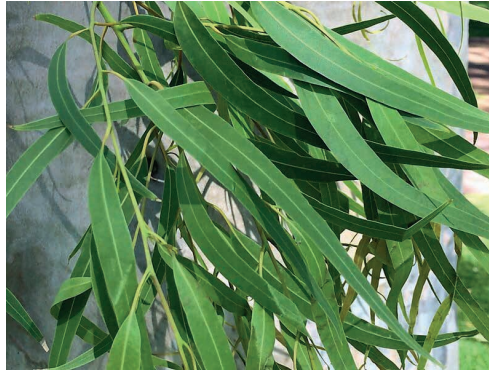
Figura 2: Corymbia citriodora