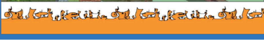
GRAFICO 1 - Lámina síntesis de socialización -XXV CLEFA – FADA 2014 - PY Gráfico de elaboración propia