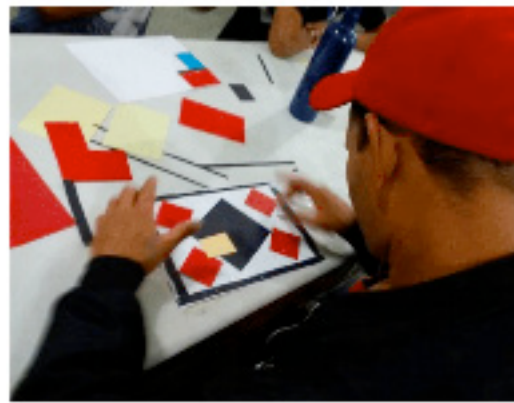
Figuras 5 e 6 - Produções de arte em colagem