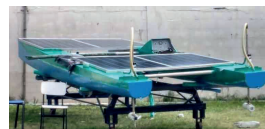
Figura 11: Barca Solar.