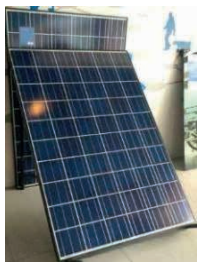
Figura 12: Placa Solar.

incorporadas ao sistema inteligente. Além disso, com a geração distribuída, o uso dos painéis fotovoltaicos (figuras 12 e 13), dos geradores eólicos (figuras 14) e dos minigeradores eólicos, é possível ter uma rede elétrica flexível que pode atender as necessidades de consumo da população. Assim, são reduzidos os investimentos na rede de distribuição e o consumo de combustíveis fósseis (ENEL, 2013).