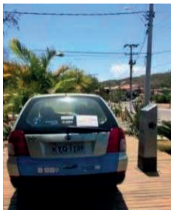
Figura 4: Carro elétrico.