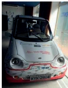
Figura 3: Carro elétrico.

Originalmente o Projeto conta com quatro carros elétricos (figuras 3 e 4), trinta bicicletas elétricas (figuras 5), quatro pontos de recarga lenta e dois pontos de recarga rápida Inteligente. A utilização de veículos elétricos torna o transporte de pessoas e cargas mais limpo e eficiente. Seu principal benefício é a redução da emissão de CO 2 produzida pelos combustíveis fósseis (ENEL, 2013).