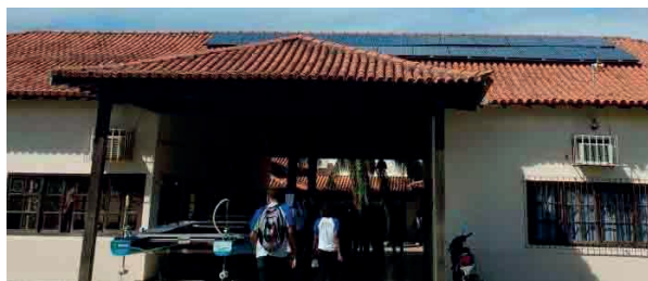
Figura 17: Placa Fotovoltaica instalada no telhado do Colégio Municipal Paulo Freire.

Em 2018, a partir de análise in loco e informações coletadas com o setor administrativo do colégio, foi possível verificar que as placas permaneciam sem funcionar e produzir energia.