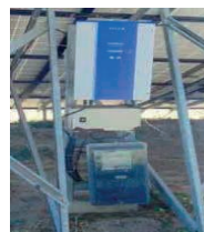
Figura 16: Placas Fotovoltaicas- APAE. Fonte: Autores, 2017.

Por meio de observações in loco, em 2018, realizadas na APAE Búzios, foi possível observar que as placas fotovoltaicas continuavam funcionando e contribuindo para a redução da tarifa mensal de energia elétrica da unidade.