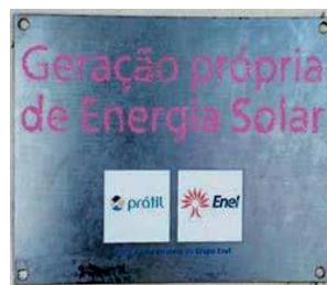
Figura 18: Placa de aviso de geração própria de energia solar.

A segunda escola visitada foi a Escola Municipal Nicomedes Theotônio Vieira. Durante análises in loco e informações coletadas, em 2017, com o setor administrativo da escola, observou-se a inexistência de informações a respeito das placas solares. Durante a análise de documentos como, por exemplo, as tarifas de energia elétrica da referida unidade, verificou-se que não existia desconto ou alguma informação na conta que indicasse uma possível produção própria de energia, indicando que as placas fotovoltaicas não estavam funcionando. O setor administrativo informou que não tinha nenhuma informação a respeito do sistema de placas fotovoltaicas e de seu possível funcionamento (figura 19). A informação obtida é que na época em que foram instaladas as placas, sobre o telhado da escola, aconteceram palestras na unidade de ensino falando de seus benefícios. Porém, a escola não foi informada como funcionaria o processo de geração de energia e como aconteceriam as possíveis reduções das tarifas mensais da Enel.