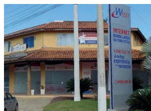
Figura 25: Comércio de internet instalado no local onde antes era localizado o Centro de Monitoramento e Pesquisa.

Quanto ao Consciência Ecoampla, segundo a Enel (2013), no período de abril de 2012 a abril de 2013 mais de 20.460 kg de resíduos e 18.638 litros de óleo foram coletados (ENEL, 2013). Porém, apesar dos bons resultados, segundo os dados coletados com a Secretaria de Educação, existiam informações que o ponto de coleta, que os cidadãos utilizavam para descartar seus resíduos de maneira mais adequada, iria fechar. Tal informação foi confirmada em observação in loco e dados coletados, em 2020, com a Secretaria de educação de Búzios. Segundo a Secretaria mencionada, o Ecoampla de Búzios fechou e os serviços que eram oferecidos ali foram transferidos para a Secretaria de Ciências de Cabo Frio. Destaca-se que esta transferência deixou a população de Búzios sem o ponto de coleta de resíduos, uma ação que além de prejudicar a formação da consciência ecológica prejudica diretamente o meio ambiente por conta dos descartes inadequados destes resíduos.