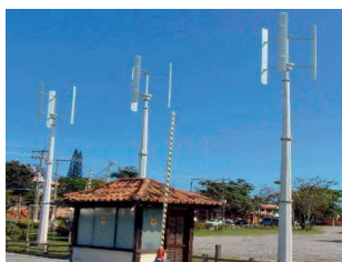
Figura 20: Gerador Eólico em manutenção no Porto da Barra.

Em relação aos geradores eólicos de energia foi possível obter algumas informações sobre a localização dos aparelhos e o destino da energia produzida por eles. Conforme informação coletada, em 2017, na Secretaria de educação de Búzios, os geradores eólicos (figura 20), estavam localizados no Porto da Barra para produzir energia e abastecer o condomínio e o complexo gastronômico ali existente. O que demonstra a aplicação do investimento para uma determinada parcela da sociedade.