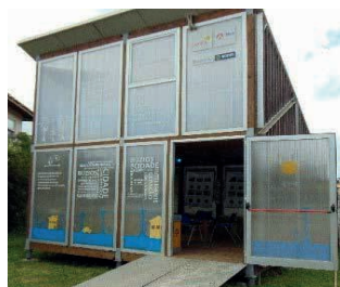
Figura 28: Triangular Operative Building .