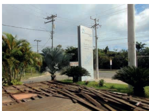
Figura 24: Abandono do Centro de Monitoramento e Pesquisa.