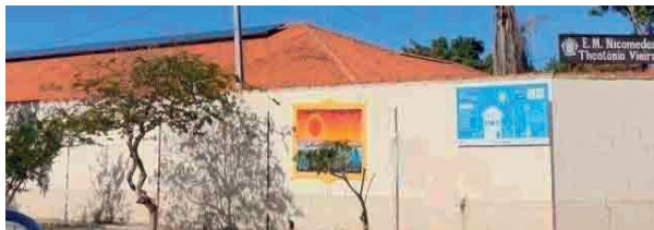
Figura 19: Placa Fotovoltaica da Escola Municipal Nicomedes Theotônio Vieira.

Em relação aos geradores eólicos de energia foi possível obter algumas informações sobre a localização dos aparelhos e o destino da energia produzida por eles. Conforme informação coletada, em 2017, na Secretaria de educação de Búzios, os geradores eólicos (figura 20), estavam localizados no Porto da Barra para produzir energia e abastecer o condomínio e o complexo gastronômico ali existente. O que demonstra a aplicação do investimento para uma determinada parcela da sociedade.