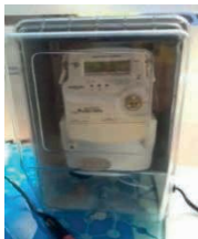
Figura 1: Medidor Inteligente de Energia.

e controlar a qualidade do serviço. Assim, possibilita-se a realização de tarifas de energia elétrica direcionadas por faixas de horário.