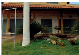
Figura 23: Abandono do Centro de Monitoramento e Pesquisa.