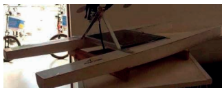
Figura 9: Maquete da Barca Solar.

Municipal Paulo Freire. A barca solar é movida a energia produzida por placas fotovoltaicas instaladas sobre ela. De acordo com a administração do colégio, a barca (Figura 10) estava sendo preparada para o Desafio Solar Brasil 2017, que aconteceria entre os meses de outubro e novembro. Em 2018, verificou-se que a barca solar continuava localizada no C. M. Paulo Freire passava por uma reforma e estava recebendo nova pintura (figura 11).