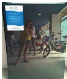
Figura 13: Placa Solar.