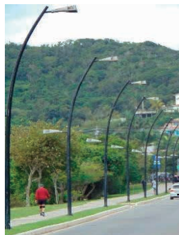
Figura 22 - Luminárias de LED que ficam localizadas em frente a Lagoa da Usina de Búzio.

Conforme o observado in loco e por meio de informações coletadas, em 2020, com a Secretaria de educação de Búzios, as luminárias da Rua da Lagoa da Usina de Búzios estão funcionando corretamente, cumprindo o objetivo do CIB.