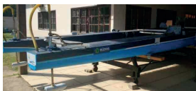
Figura 10: Barca Solar.