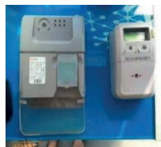
Figura 2: Concentrador.

O consumidor paga pela eletricidade conforme as necessidades e os horários que mais utiliza e as distribuidoras têm a possibilidade de ajustar os preços das tarifas conforme os horários. O cliente, no que lhe concerne, pode optar pelas tarifas mais favoráveis moldando os seus próprios hábitos de consumo ao ter consciência que a utilização de energia elétrica é mais cara nos horários de pico, alcançando uma redução de até 30% em sua tarifa mensal (ENEL, 2013).