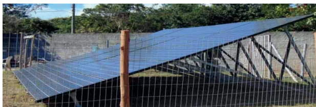
Figura 15: Placas Fotovoltaicas- APAE.

De acordo com informações coletadas, em 2017, com a administração da APAE Búzios, as placas fotovoltaicas (figuras 15 e 16), efetivamente funcionavam e grande foi a redução da conta de energia da unidade. A tarifa mensal de energia elétrica que girava em torno de cinco mil reais foi reduzida para cerca de oitocentos reais.