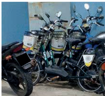
Figura 6: Bicicleta Elétrica.

A população recebeu, de forma positiva, a proposta das bicicletas elétricas, visto que este novo meio de locomoção poderia contribuir para a cidade de Búzios, pois o trânsito na cidade em época de alta temporada é intenso e substituir parte da frota de carros por bicicletas seria uma solução. Contudo, durante a pesquisa foi possível observar que não houve investimento, na cidade, no que se refere a ciclovias. Conforme representado pela figura 7 e 8 as pessoas se ariscam em meio aos carros e utilizam as calçadas de pedestres para transitar de bicicleta.