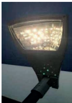
Figura 21: Luminária de LED.

para que redes elétricas flexíveis sejam implementadas (ENEL, 2013). Quanto à iluminação inteligente, durante a análise realizada in loco , só foi possível encontrar as Luminárias de LED nas ruas da Lagoa da Usina de Búzios (figura 22).