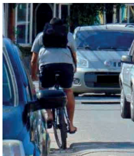
Figura 7: Ausência de Ciclovias.