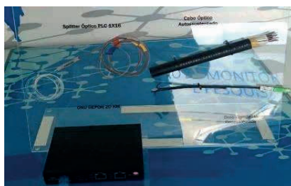
Figura 29: Aparelho e cabos de Internet.

O CIB possui o objetivo de oferecer internet wifi gratuita inteligente em áreas da cidade para os cidadãos e turistas (figura 29). Os pontos de instalação da internet são a praça Santos Dumont e a rua das Pedras.