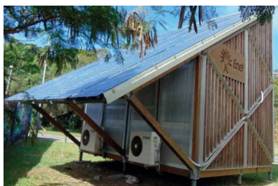
Figura 27: Triangular Operative Building .