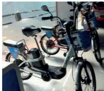
Figura 5: Bicicletas Elétricas.