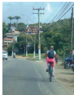
Figura 8: Ausência de Ciclovias.

Segundo informações da Secretaria de Educação, em 2017, houve registro de agentes públicos passando na rua utilizando as bicicletas elétricas, seguindo o objetivo do Projeto, porém nunca foi observado a utilização e circulação dos carros elétricos pela cidade. Durante a pesquisa também não foi possível localizar nem saber o destino que tiveram os carros elétricos.