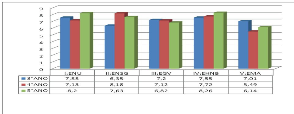
Gráfico 1 - Média das escolas por ano (série) do GE (Grupo Experimental).

Neste gráfico, verificou-se a média das escolas por ano do grupo experimental, onde identificamos que os 3º e 5º anos foram eficientes em duas escolas ficando o 4º ano como líder em apenas uma escola. Vale salientar que a maior média ficou com a turma do 5º ano da EHNB.