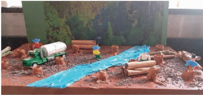
Figura 3. Maquete do desmatamento