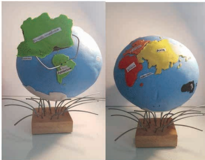
Figura 4 - 5. Maquete do planeta Terra

Realizamos leituras de diferentes matérias que relacionavam a biodiversidade amazônica à inteligência artificial (IA), que nos levaram a agrupar o uso da IA em duas aplicações: identificação de anormalidades na Amazônia e ações de preservação da floresta amazônica. Os aplicativos e projetos foram listados e inseridos na tabela a seguir que apresenta as principais técnicas desenvolvidas para cada tipo de aplicação da IA.