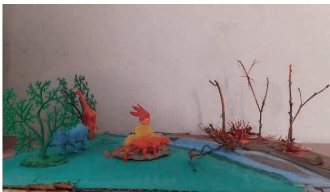
Figura 2. Maquete das queimadas