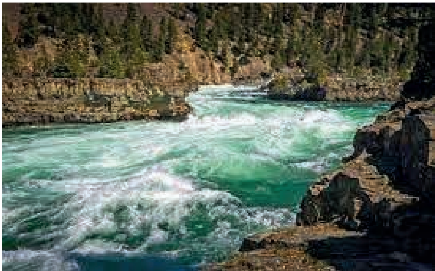
Figura 1. Río Caudaloso

En la vida de los ecosistemas, hay repercusiones favorables o desfavorables; y lo mismo sucede entre sistemas que comparten elementos. Ejemplo: un río proveniente del deshielo, baja de las alturas y se diluye en los entornos necesarios para que subsistan otros sistemas que pueden contener elementos básicos, en diferentes modalidades y proporciones. Así un río caudaloso (Figura 1) se hace vital para grupos humanos que, de acuerdo a sus posibilidades tecnológicas, se abastecen de éste, además deriva en ríos más pequeños o riachuelos, o solo conserva la humedad del subsuelo. Como líquido vital contiene los mismos elementos para el apoyo de todos los sistemas y sus integrantes. También es un signo de vida en zonas altas o secas, deja olores o permanece en bajo suelo alimentando musgos que cobijan insectos, para aves que son presa alimenticia de mamíferos inferiores y superiores; los restos mortales de todos se vuelven al “todo” (Hernández).