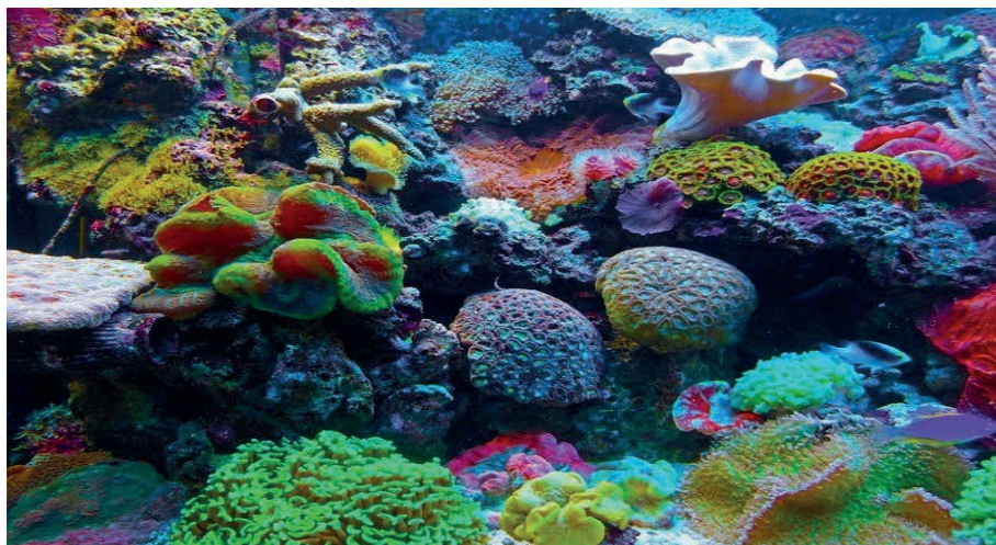
Figura 2. Subsistemas del ecosistema mar

al ecosistema en su conjunto. La armonía del conjunto responde a un principio inteligente de equilibrio homeostático, que sostiene la energía para conservar la salud de los seres vivos, y “del todo”. Esto es posible por un complejísimo mecanismo de conectividad entre todos los integrantes del Ecosistema, que Odum y Barrett (1971) descubrieron y describieron como un poder energético y dislocante, que no emerge de una sola fuente. Se puede entender que la inteligencia del proceso homeostático se despliega en todos los sistemas que constituyen el ecosistema, y sus elementos para conservarse como un todo.