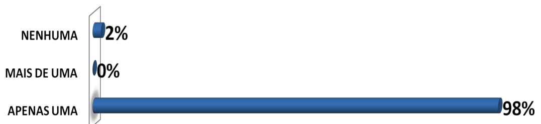
Gráfico 03: Você conhece teorias que versam sobre o desenvolvimento da criança?

Nesse sentido, os professores colaboradores da pesquisa foram questionados sobre esse tema, o resultado desse questionamento está representado no gráfico 02 cujos os dados mostram que grande parte dos professores reconhecem a necessidade do conhecimento das fases do desenvolvimento humano para potencializar o processo de aprendizagem, o que vai ao encontro do pensamento de Wallom ao afirmar que a afetividade caminha junto com o cognitivo e se influenciam mutuamente.