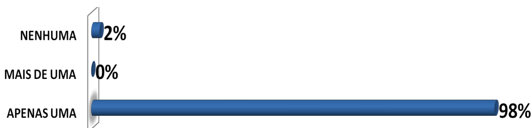
Gráfico 02: Você tem conhecimento acerca das fases do desenvolvimento infantil?

A constatação de que existe entre os professores, uma consciência clara acerca da relevância da afetividade para o processo de ensino é algo positivo e acena para a construção de uma educação mais humanizada.