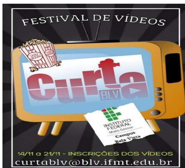
Figura 4 - Banner do IV Festival. Tema: Direitos Humanos e da Terra, 2017

Em 2017, houve a IV edição do festival, que envolveu estudantes dos cursos técnicos integrados ao ensino médio, cursos técnicos subsequentes e cursos superiores, visando uma integração entre os diferentes públicos e níveis de ensino, promovendo a verticalização do tema e um debate de temas pertinentes aos dilemas da sociedade (Figura 4).