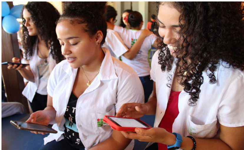
Figura 13 - Alunas do IFMT campus Bela Vista, no evento de lançamento do aplicativo “Viva Feliz Bullying Não”2020