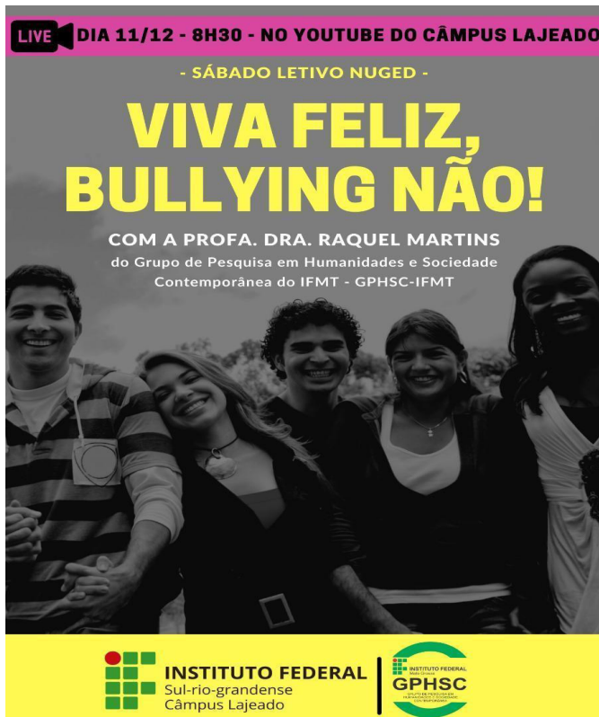
Figura 18 - Banner Palestra online: Viva Feliz, Bullying Não