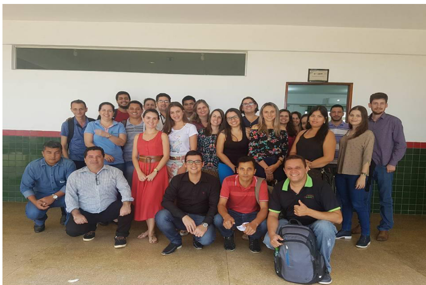
Figura 17 - Formação com docentes do IFMT Campus Campo Novo dos Parecis

O GPHSC - IFMT também foi convidado para uma palestra reunião pedagógica IFMT - Campo Novo dos Parecis; cujos estudantes já haviam participado do CURTABLV e já se sensibilizaram com a temática. Após a ação formativa no campus , o mesmo grupo participou da pesquisa diagnóstica sobre bullying . O objetivo foi promover a capacitação dos docentes sobre o tema, promovendo a sensibilização e estratégias de atuação para combater a problemática, partindo do entendimento de que o professor é agente de transformação social e precisa abordar essas problemáticas em sala de aula (Figura 17).