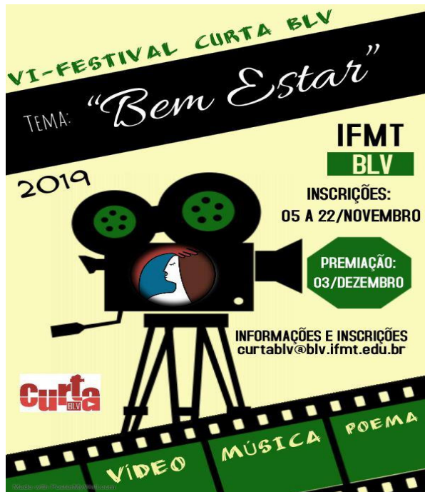
Figura 10 - Banner do VI festival Curta BLV, 2019. com o tema: Bem Estar. Organizado pelo Grupo em Estudos em Humanidades e Sociedade Contemporânea do IFMT

Foto: Banner VI Festival Curta BLV, 2019.