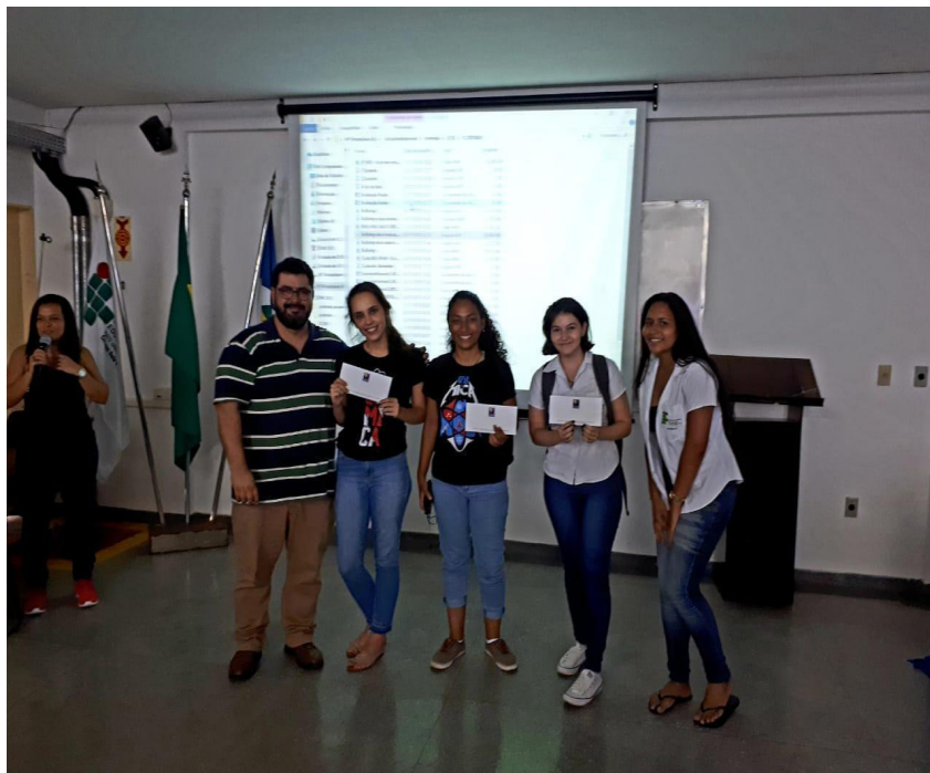
Figura 8 - Premiação do V Festival Curta BLV, 2018.