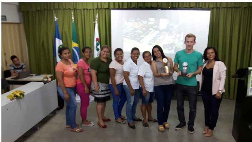
Figura 6 - Solenidade de encerramento do festival. troféus do IV Festival Curta BLV. 2017

É possível acessando o link indicado assistir ao vídeo de divulgação do evento que culminou com a premiação com troféus personalizados para o festival (Figura 6).