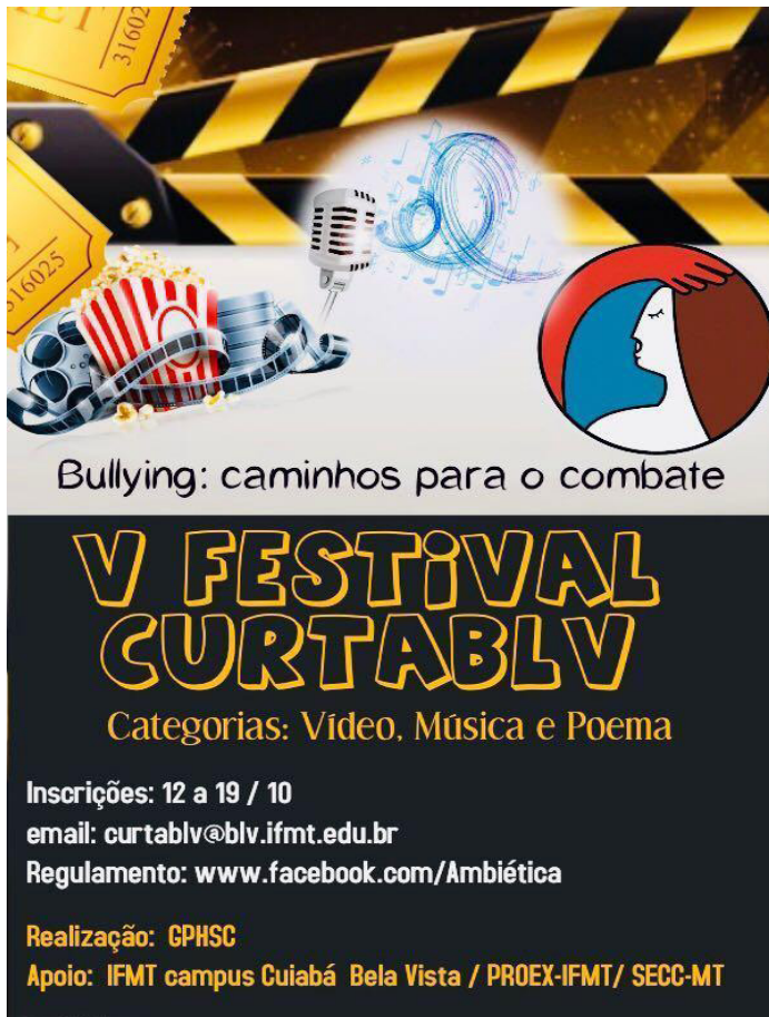
Figura 7 - Banner do V Festival Curta BLV, modalidade vídeo, música e poema. Realizado pelo GPHSC, com o Tema: Bullying , Caminhos para o combate/2019