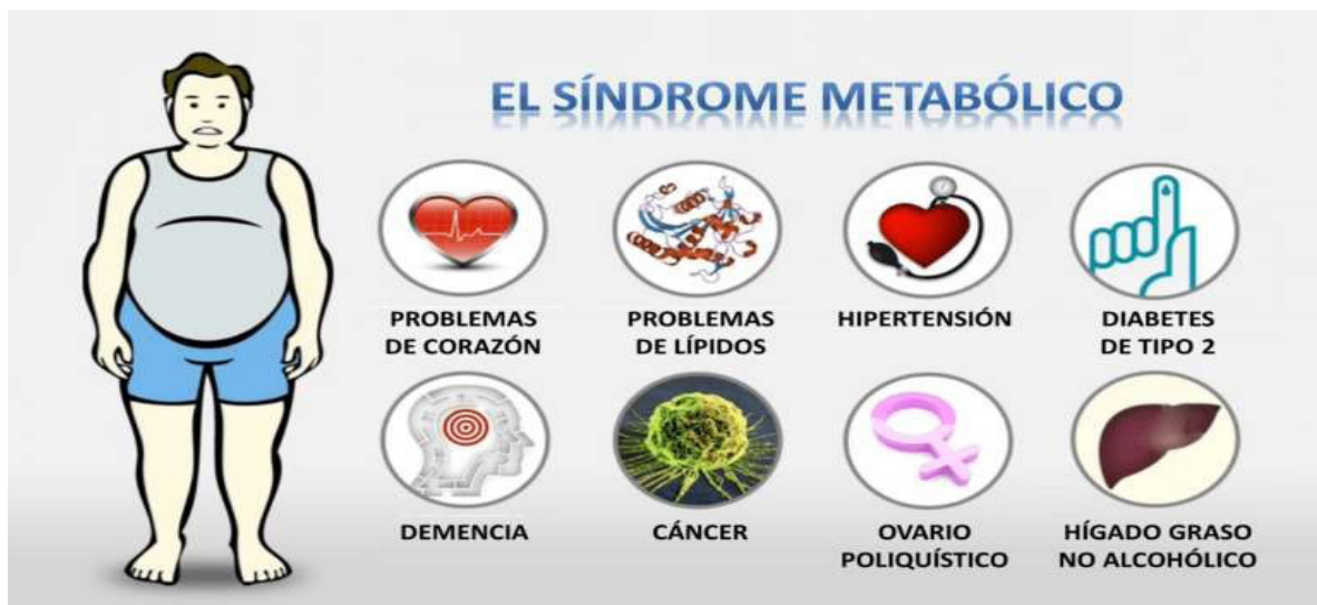
Figura No. 3. Síndrome metabólico