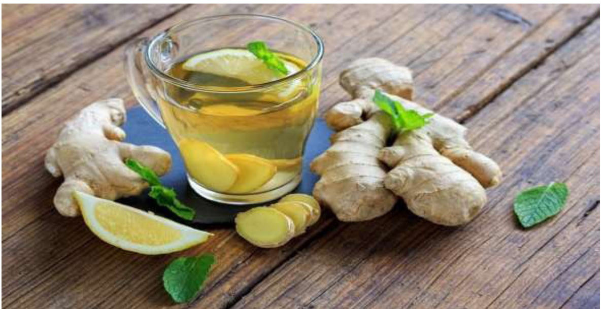
Figura No. 2. Infusión de jengibre ( Zingiber officinale )

Fuente: Tomada de: https://www.alimentacionbalanceada.com/que-es-una-dieta-balanceada/ Recuperada el 2 de agosto de 2021. 10:00 pm.