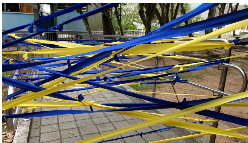
Grupo de professoras, Instalação Interativa

Com as atividades em vias de finalização remeti-me novamente à pesquisa de Leite, quando menciona que em suas propostas de formação continuada os professores participantes não deixam de exprimir seus descontentamentos na medida em que os cursos promovem ainda mais o distanciamento entre teoria e prática em sala de aula. Na contra mão disso, Leite afirma que grande parte dos cursos de formação continuada ainda acentuam o caráter de desenvolvimento de resultados finais e tudo aquilo que diz respeito à melhoria dos processos de ensino e aprendizagem. Quer dizer, grande parte dos cursos de formação continuada estão dentro do senso comum e se enquadram nas necessidades de demonstrar bons resultados em uma prática educativa.