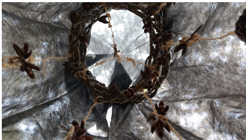
Grupo de professoras, Instalação Objeto, Fonte: acervo pessoal

Ainda assim, muitos dos professores pensavam em estratégias para levar tudo aquilo para a sala de aula, mas de outra forma e também contando com a imprevisibilidade e com os acasos que pudessem ocorrer, pois nada era fixo e determinado. Então, foram produzidas instalações, pinturas, objetos e uma quantidade de produções que agrupam inúmeras determinações artísticas, como pode-se observar em algumas imagens.