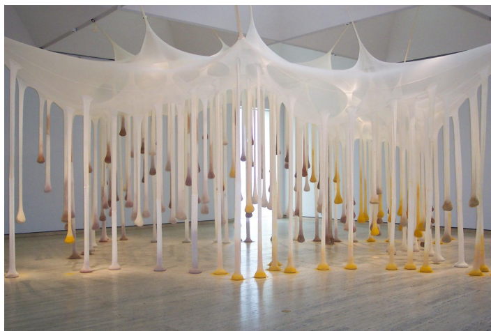
Ernesto Neto, S/ Título

Aqui trouxemos para o mesmo plano arte e arquitetura, modernidade e contemporaneidade. Sem distinções e sem as supremacias estabelecidas pelos currículos estagnados. É interessante pensar também que, mesmo não tendo visitado museus, os próprios professores pensaram que os projetos e artefatos produzidos por Gaudí se relacionavam com obras contemporâneas, já que apresentavam um caráter não narrativo e não explicativo daquilo que estava sendo apresentado.