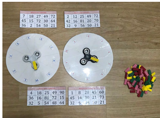
Figura 6 - Roleta da tabuada.

O quinto encontro foi desenvolvido a partir dos conceitos de multiplicação e de divisão. Inicialmente, trocas de experiências e discussão de dificuldades no ensino e aprendizagem foram realizadas e após os materiais citados abaixo foram utilizados para auxiliar na ressignificação de tais conteúdos.