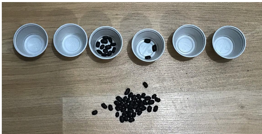
Figura 3 – Material concreto utilizado na atividade de mudanças de bases.

Dando sequência às ressignificações, o terceiro encontro foi desenvolvido a partir dos conceitos de bases numéricas, iniciando pelos conhecimentos prévios das professoras em relação à BASE 10 e na sequência com atividades concretas e abstratas de transformações de números em diferentes bases, utilizando bases binárias, ternária, quaternária, entre outras. Nesta atividade, foi utilizado um material para estudo dirigido e materiais manipuláveis como copos plásticos e feijões, como ilustra na figura abaixo.