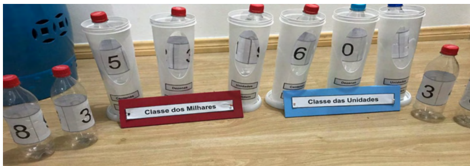
Figura 2 - Representação dos números no QVL de garrafas.