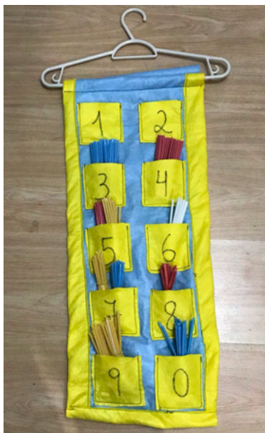
Figura 1 - Números e Numeral.

Para o segundo encontro o conteúdo abordado foi o conceito de número e como materiais manipuláveis ou digitais foram propostas as atividades listadas abaixo: