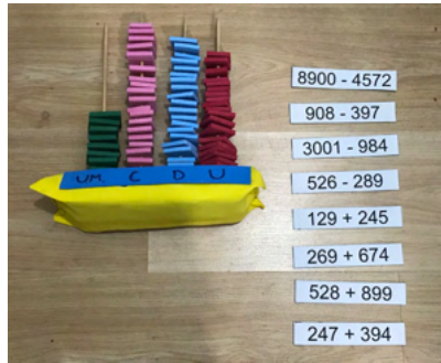
Figura 5 - Operações no ábaco de pinos.