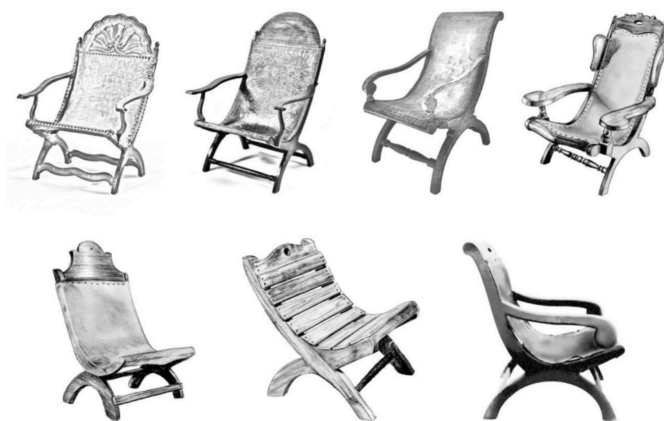
Ilustración 1. Butaques Siglos XVII al XIX. Sup. Izquierda a derecha: A. Butaca, 1730-1770, Museo de Filadelfia, Pensilvania, catálogo, inv. 2012-178digital -1, https://philamuseum.org/collections/permanent/313148.html, dibujo de: AMTR. B. Silla Campeche, ca. 1820, Museo James Madison, Orange, Virginia, catálogo digital, https://www.thejamesmadisonmuseum.net/exhibits?lightbox=dataItem-if1a9rtn, dibujo de: AJRT; c. Butaque S. XIX, Gran Museo del Mundo Maya de Mérida, Yucatán, dibujo de AMTR; d. Silla Campeche, S. XVIII, Museo de Arte Colonial, La Habana, sd. Cuba, dibujo de: JRRT; Abajo: e. Butaque con piel de venado, S. XIX, procedencia de Yucatán, recuperada de: https://donshoemaker.com/what-is-the-difference-between-a-mexican-campeche-chair-and-a-butaque-part-2/#jp-carousel-5797, dibujo JRRT; f. Butaque popular de la región de Tehuantepec, Oax. S. XX, Sala 18 de etnografía, Museo Nacional de Antropología, dibujo de JRRT; g. Butaque, S. XIX, Centro Cultural “El Palacio”, Campeche, Campeche, s/d, dibujo JAIJ.