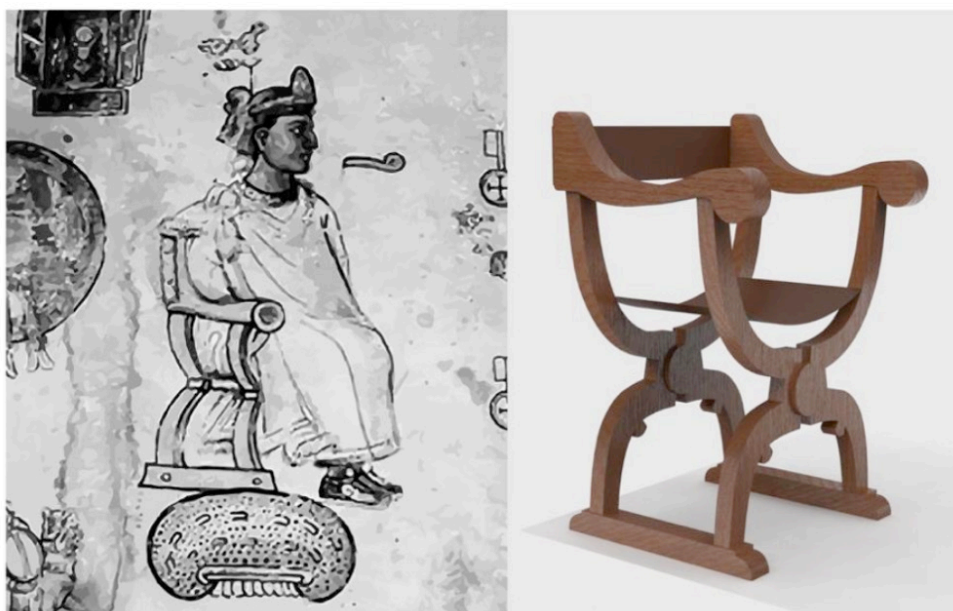
Ilustración 5. Izq. Detalle de la lámina 1 de la Tira de Tlatelolco representando al cacique sentado en una silla de caderas, ca. 1562; original se encuentra en la Biblioteca Nacional de Antropología e Historia, sig. 35-39; recuperada de Mediateca INAH,