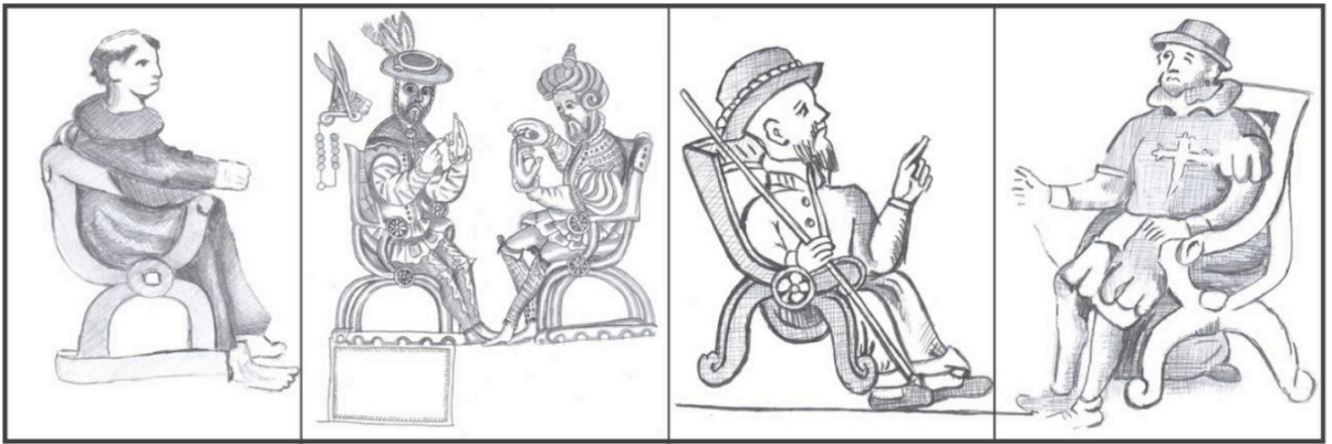
Ilustración 6. Códices Coloniales: Detalle de la Tira de San Juan Teotihuacán, S. XVI, original se encuentra en la BNAH Dr. Eusebio Dávalos Hurtado; Lámina del Códice de Yanhuatlán, 1544, reprografía. I.O. "CXLVIII-99, Fototeca Nacional, recuperado de: Mediateca INAH; Detalle de la lámina 1AA del Códice de Huejotzingo, S. XVI, original en la BNAH. Detalle de la tira de Tlaxcala, S. XVI, Copia realizada por José Manuel Yllañez en 1773, resguardada en la BNAH, recuperado de https://www.codices.inah.gob.mx/movil/contenido.php?id=50 . Dibujos: