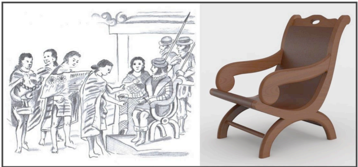
Ilustración 7. Detalle de la Tira de Tlaxcala, recuadro C, S. XVI, copia realizada por José Manuel Yllañez en 1773, resguardada en la BNAH, recuperado de https://www.codices.inah.gob.mx/movil/contenido.php?id=51 Calca del original, elaborado por José Antonio Ibarra; Original: Mediateca INAH. Derecha, dibujo digital de butaque, basado en el ejemplar resguardado en el museo El Palacio, de Campeche, elaborado por AAR.