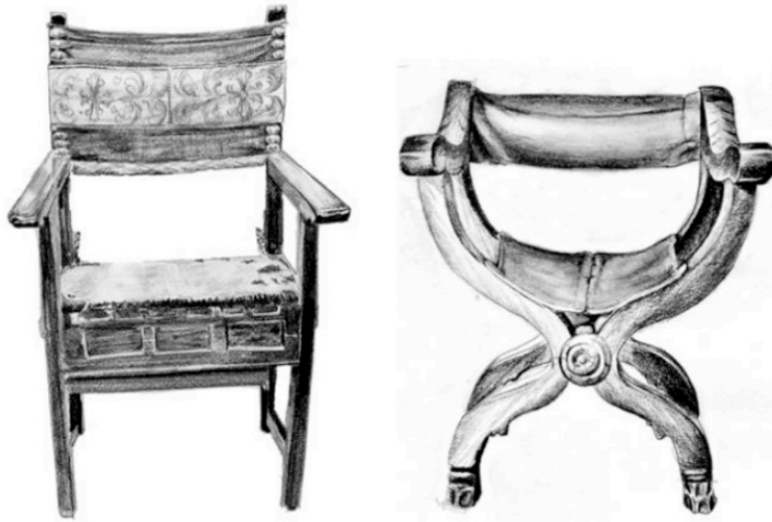
Ilustración 2. Ejemplos de tipos de asientos de origen europeo utilizados durante el siglo XVI en México: izq. Silla Francesa con brazos de madera y terciopelo al aire para asiento y respaldo, fijos por medio de clavos ovoidales, respaldo con bordado, chambrana delantero, de manufactura española; ca. 1501-1600, MNAD, Madrid, catálogo digital, inv:CE00529, http://ceres.mcu.es/pages/Main. Der. Silla de caderas o jamuga, madera tallada y asiento de cuero cosido, S. XVI, Museo Regional Cuauhnáhuac, Cuernavaca Mor.